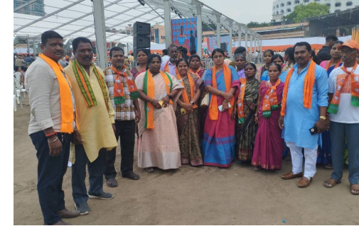
మోడీ సభకు వెళ్లిన రాజేంద్రనగర్ డివిజన్ బిజెపి నాయకులు, నాయకు రాళ్లు