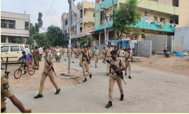
మైలారదేవపల్లి డివిజన్లో పోలీసుల రూల్ మార్చ్