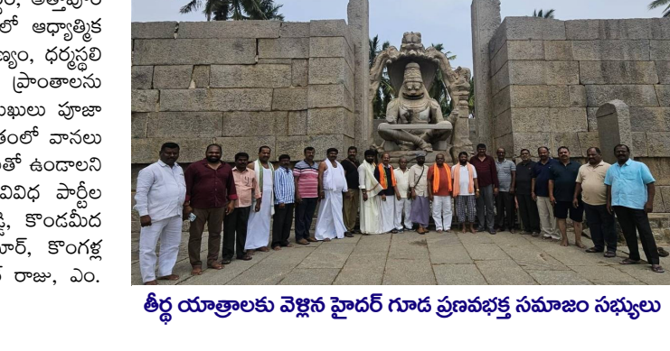
తీర్థ యాత్రలకు వెళ్లిన హైదర్ గూడ ప్రణవభక్త సమాజం సభ్యులు