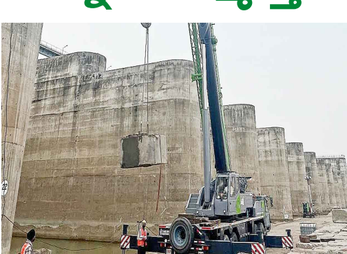
అవ్వేపిమ్, డౌన్ స్ట్రీమ్లో వరద నీటి ప్రవాహానికి అడ్డుగా ఉన్న ఇసుక, రాళ్లను తొలగిస్తున్నారు.

మహావేపపూర్, మే 29 (సమస్య ఉదయం): జరుశంకర్ భూపాలపల్లి జిల్లా మహావేపపూర్ మండలంలోని అంబట్పల్లి గ్రామంలో ఉన్న మేడిగడ్డ లక్ష్మీ బరాజ్లో మరమ్మత్తు పనులు కొనసాగుతున్నాయి. ఈ పనులను బద్దవారం భారీ నీటిపారుదల శాఖ ఈఈ తిరుపతిరావు పర్యవేక్షించారు. వసుల తీరుపై అధికారులతో చర్చించారు. బరాజ్లోని విదో బ్లాక్లో కుంగిన పియర్ బ్లాక్ ప్రదేశాలతో గ్రౌండ్ చేసేందుకు ప్రారంభించిన బోర్ హోల్ పనులు, 20, 21 గేట్ కట్టింగ్, బరాజ్ దిగువన వరద ఉద్ధతితో ఎలాంటి ప్రభావం లేకుండా ఉండేందుకు ఇసుకలో కావల్సిన పిల్ట్ లోలు అయింట్లా సాయంతో అమలుతున్నాయి. వరద నీటితో ఇబ్బందులు లేకుండా ఉండేందుకు బరాజ్ ఎనిమిదో బ్లాక్ వరకు వరద నీటి ప్రవాహం రాకుండా మట్టి కరకల్లు పనులు జరుగుతున్నాయి. బరాజ్ దిగువన సీసీ బ్లాక్ అమలుతున్నాయి.