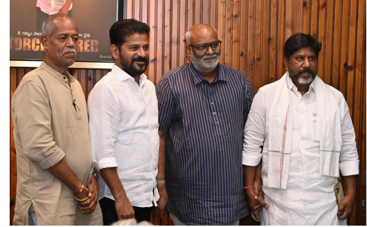
కలిసి ముఖ్యమంత్రి రేవంత్ సమాఖ్య చేపట్టారు. సాయంత్రం వరకు పాటు సంబంధించి పూర్తిస్థాయిలో కౌలిక వచ్చే

మొదటిపేజీ తరువాయి.. భట్టి విక్రమ్ రావు హాజరయ్యారు. తెలంగాణ గీతం, తెలంగాణ లోగో ఎంపిక పై వారిద్దరూ చర్చించారు. మరోవైపు.. తెలంగాణ రాష్ట్ర గీతం రూపకల్పన తుది దశకు చేరుకుంది. ఈ క్రమంలో.. గీతం రూపకల్పనపై కవి అందెశ్రీ, సంగీత దర్శకుడు కీరవాణిశర్మ ఉపముఖ్యమంత్రి భట్టి విక్రమ్ రావుతో