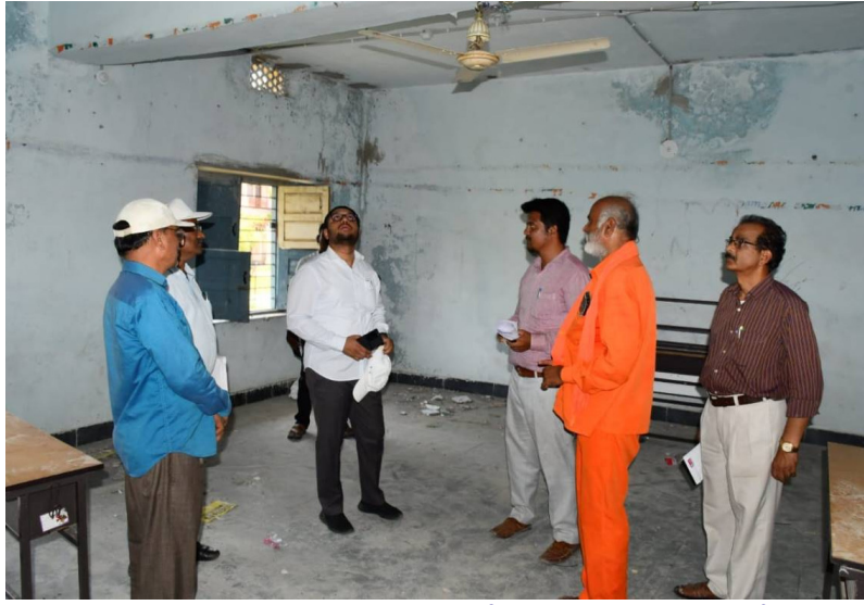
గోదాం భవన పరిస్థితిని పరిశీలిస్తున్న కిసాన్ సమృద్ధి కేంద్రాన్ని పరిశీలిస్తున్న అదన కలెక్టర్