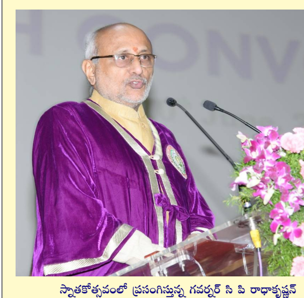
స్నాతకోత్సవంలో ప్రసంగిస్తున్న గవర్నర్ సి పి రాధాకృష్ణన్