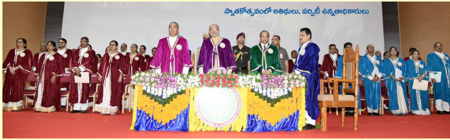
స్నాతకోత్సవంలో అతిథులు, వర్సిటీ ఉన్నతాధికారులు