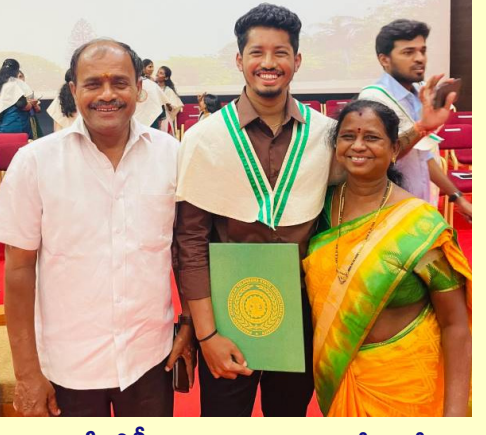
ఎమ్మెస్సీ డిగ్రీ పట్టా అందుకున్న సంతోషంలో తల్లితండ్రులతో గుండాల ప్రణయ్