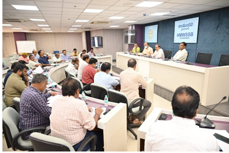
సమీక్ష సమావేశంలో పాల్గొన్న జలమండలి నిజం, జిఎం, జిఎం, జిఎం