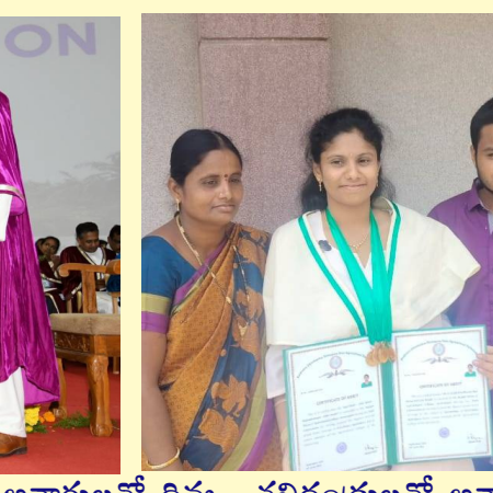
గర్విస్తున్నారన్నారు. 77 ఏళ్ల స్వతంత్ర భారతదేశం అనేక రంగాల్లో అభివృద్ధి చెందింది త్వరలోనే ప్రపంచంలోనే మూడవ అధిక వృద్ధుల అవతరించనున్నదని అనేక ప్రపంచ సంస్థలు అంచనా వేస్తున్నాయన్నారు. 2047 నాటికి 'వికసిత' భారతీగా పరిణమించనున్నామని శ్రీనివాసులు శెట్టి వివరించారు. వాతావరణ మార్పులకి అనుగుణంగా వ్యవసాయరంగం అభివృద్ధికి అధునాతన టెక్నాలజీలు దోహదం చేయాలన్నారు. వ్యవసాయంతో