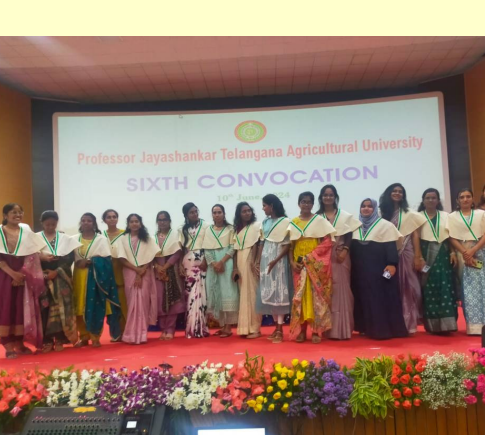
డిగ్రీ పట్టాలు పొందిన సంతోషంలో వ్యవసాయ పట్టభద్రులు