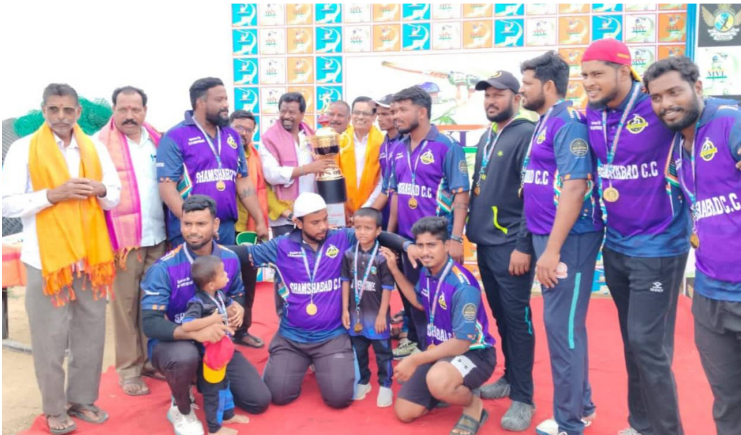
శేరుదం జరిగింది తొందుపల్లి టీకీ రస్సర్ కవ్ అంద జేయడం జరిగింది.