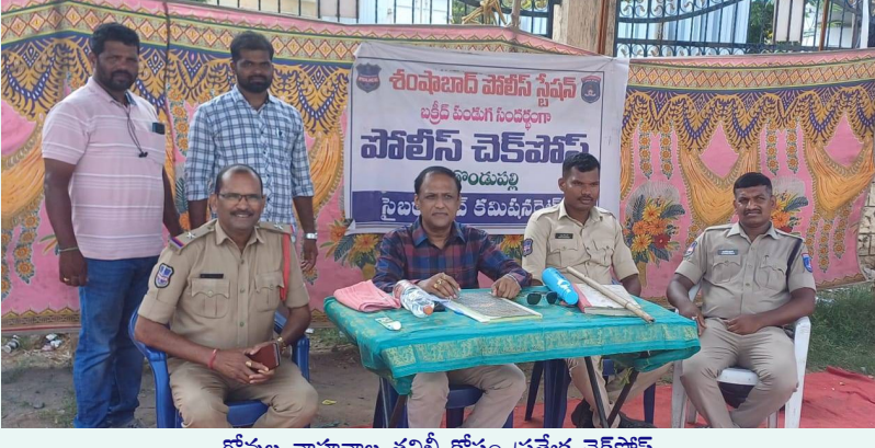
గోవుల వాహనాల తనిఖీ కోసం ప్రత్యేక చెక్ పోస్టు