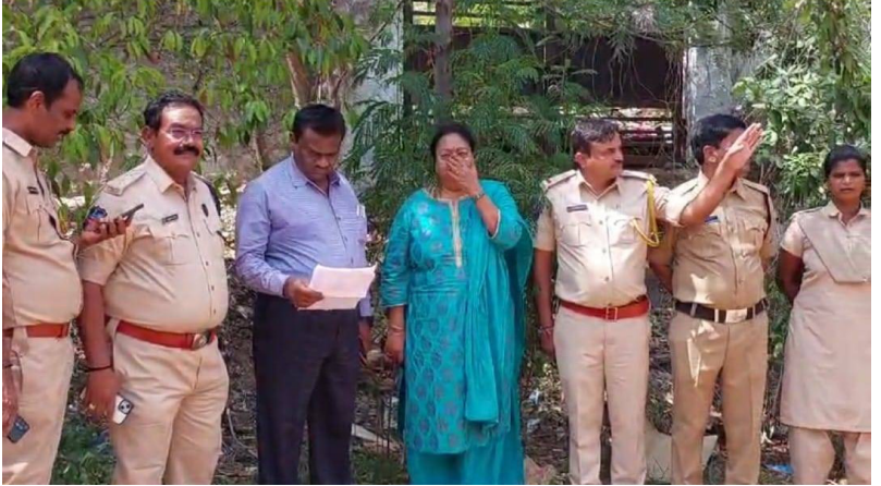
అక్రమంగా తరలిస్తున్న మద్యం స్వాధీనం చేసుకుని రోలర్ తో ధ్వంసం చేస్తున్న ఎక్సైజ్ అధికారులు, వివరాలు వెల్లడిస్తున్న ఎక్సైజ్ అధికారులు