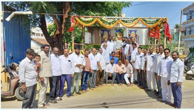
బుద్వేల్ బోడ్రాయి ప్రతిష్ఠాపన దినోత్సవ వేడుకలలో పాల్గొన్న పెద్దలు, బోడ్రాయి కమిటీ ప్రతినిధులు