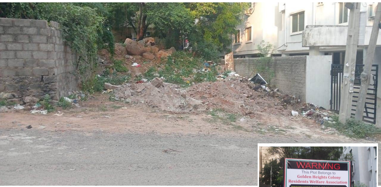
సెక్టిక ట్యాంకు ఉన్న స్థలంలో బోర్డు పాతిన కాలనివాసులు, బోర్డు తొలగించిన కబ్జాదారులు