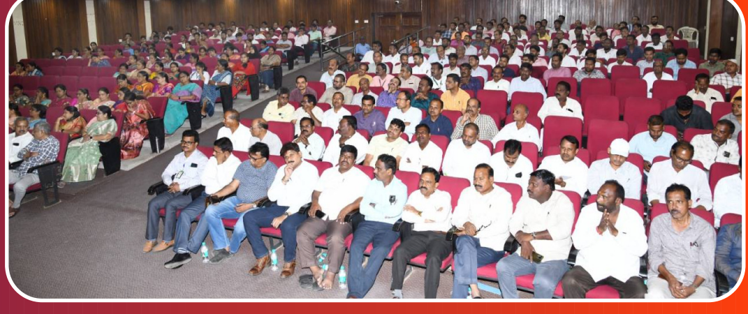
ఉత్సవాల కార్యక్రమంలో పాల్గొన్న విశ్వవిద్యాలయం అధికారులు, ఉద్యోగులు