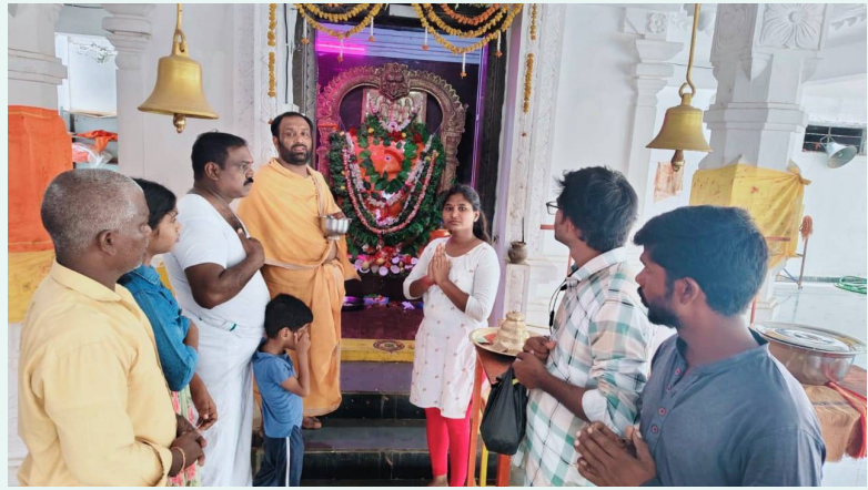
అంజనేయ స్వామి దర్శించుకుంటున్న భక్తులు