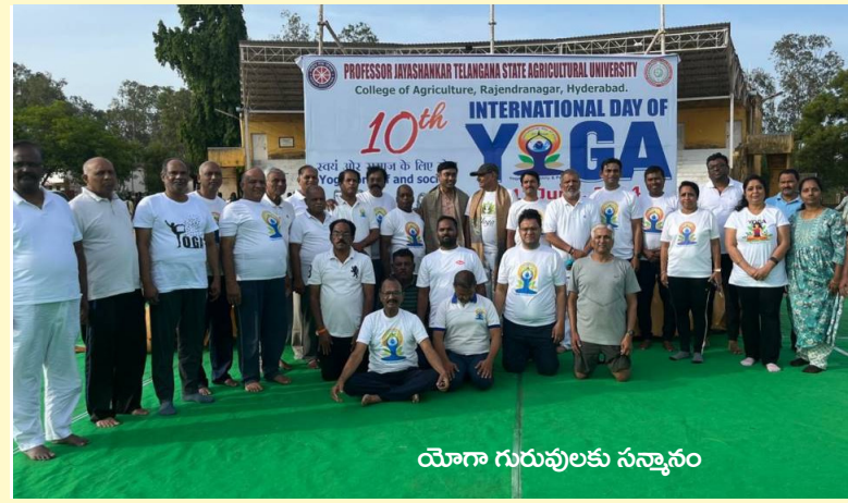
యోగా గురువులకు సన్మానం

యోగాలో పాల్గొన్న చేవెళ్ల ఎంపీ కొండా విశ్వేశ్వర్ రెడ్డి