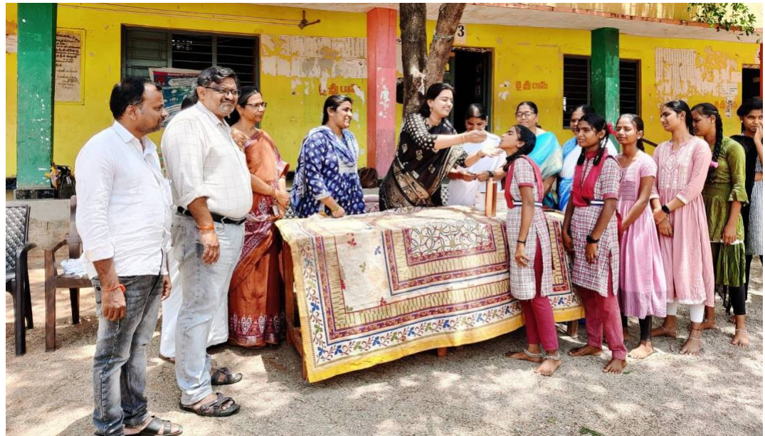
విద్యార్థులకు నూలి పురుగుల నివారణ మందు చుక్కలను వేస్తున్న జడ్పిటిసి