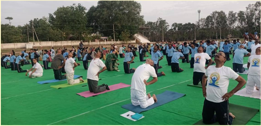
వ్యవసాయ విశ్వవిద్యాలయంలో సాక్స్ డి.కె.ఎస్.లో యోగా చేస్తున్న శాస్త్రవేత్తలు, అధ్యాపకులు, ఉద్యోగులు