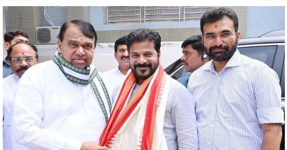
సీఎం రేవంత్ రెడ్డికి కందువా కప్పుతున్న మాజీ స్పీకర్, ఎమ్మెల్యే పోచారం శ్రీనివాస్ రెడ్డి

కోల్ బెల్ట్ లో సింగరేణి గమల మధ్యలో ఉన్న బ్లాకులను వేలం వేసే ప్రయత్నాలను మిగతా.. 2లో