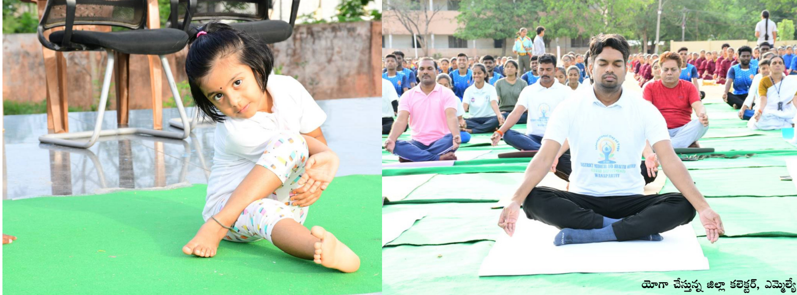
యోగా చేస్తున్న జిల్లా కలెక్టర్, ఎమ్మెల్యే