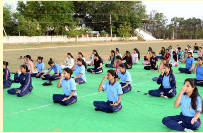
వ్యవసాయ విశ్వవిద్యాలయంలో యోగా చేస్తున్న విద్యార్థులు