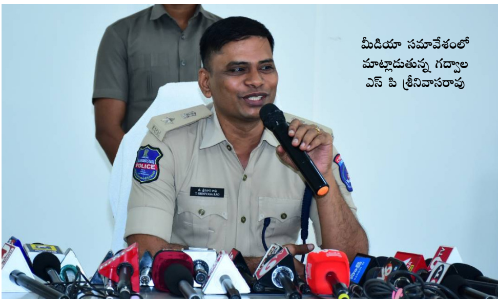
మీడియా సమావేశంలో మాట్లాడుతున్న గద్దూల ఎస్ పి శ్రీనివాసరావు

దృష్టిలో పెట్టుకొని వారికి భరోసా కలిగించే విధంగా పోలీసింగ్ వుంటుంది, శాంతి భద్రతల విషయంలోను కఠినంగా వుంటామని, ఎవరైనా శాంతి భద్రతలకు విఘాతం కలిగిస్తే సహించేది లేదని, విద్యేషాలను రెచ్చ గోట్టేవారి పట్ల కఠినంగా వ్యవహరిస్తామని అని అన్నారు.