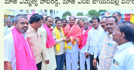
ఎమ్మెల్యే కృష్ణమోహన్ రెడ్డిని సన్మానిస్తున్న ప్రతినిధులు

గద్దూల ఎమ్మెల్యే తెలియజేశారు. ఈ కార్యక్రమంలో రాయచూరు ఎంపీ జి. కుమార్ నాయక్, రాయచూరు మాజీ ఎమ్మెల్యే పాపిరెడ్డి, మాజీ ఎంపీ బోయినపల్లి వినోద్