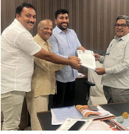
ఫిర్యాదు చేస్తున్న సిటిజన్స్ కౌన్సిల్ సభ్యులు