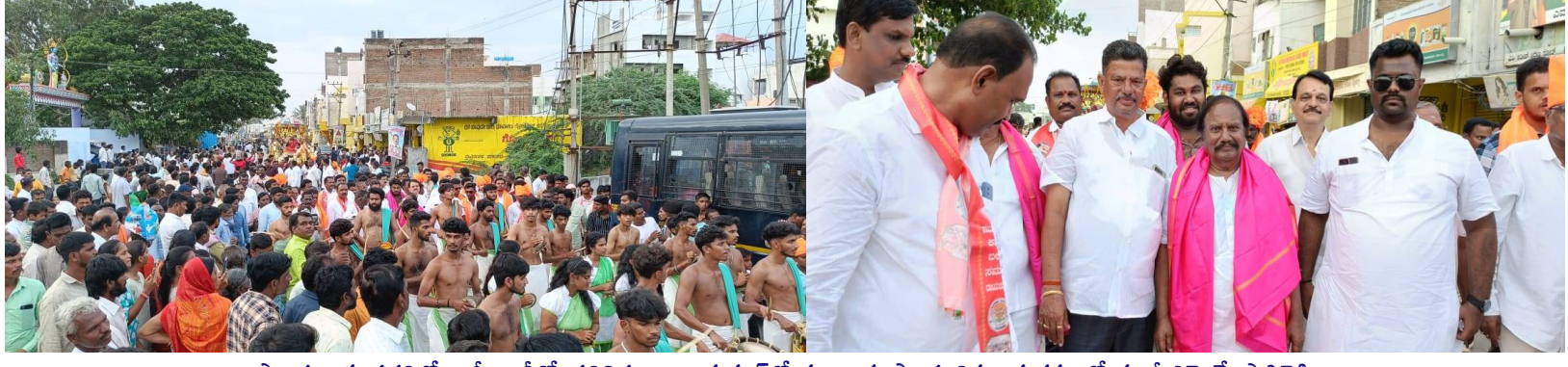
సాంప్రదాయ పద్ధతిలో భారీ ర్యాలీతో ప్రతినిధులు, రాయచూర్లో ముంగారు సాంస్కృతిక కార్యక్రమంలో మాజీ ఎమ్మెల్యే పాపిరెడ్డి