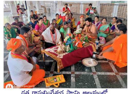
దత్త రామలింగేశ్వర స్వామి ఆలయంలో బ్రహ్మచారులు నిర్వహిస్తున్న భక్తులు

వాయిద్యాలతో అర్చకులు వేదమంత్రాల మధ్య అశేష భక్త జన సందోహం తిలకిస్తుండగా వైభవోపేతంగా కళ్యాణం జరిగింది. అనంతరం అలయకమిటీ భక్తులకు అన్నదానం చేశారు.