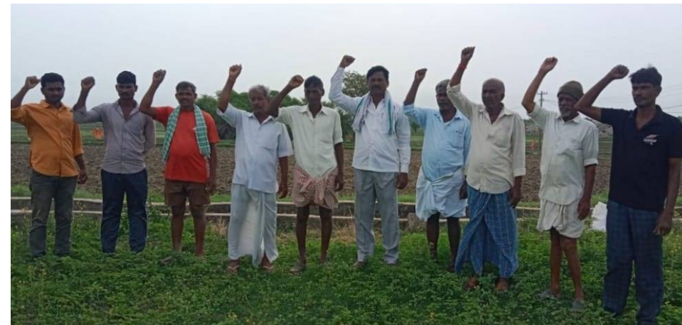
రైతు రుణమాఫీని ప్రభుత్వం ప్రకటించటంతో సంతోషం వ్యక్తం చేస్తున్న రైతులు

ఎక్కడ కూడా చేత పేరుకుపోకుండా అన్ని పరిసరాలను పరిశుభ్రంగా ఉండేలా చర్యలు తీసుకోవాలని సూచించారు. డివిజన్ పరిధిలోని చేత సేకరణకు కావాల్సిన చెత్త రిక్షాలను మరకొన్న అందుబాటులోకి తీసుకువస్తానని కార్పొరేటర్ పేర్కొన్నారు. ఈ కార్యక్రమంలో జీహెచ్ ఎంసీ శానిటేషన్ డిపార్ట్మెంట్ డీఈ శ్రీనివాస్, శానిటేషన్ ఇన్స్పెక్టర్ సమేత, సిబ్బంది తదితరులు పాల్గొన్నారు.