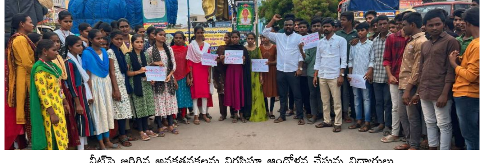
సీట్లపై జరిగిన అవకతవకలను నిరసిస్తూ ఆందోళన చేస్తున్న విద్యార్థులు