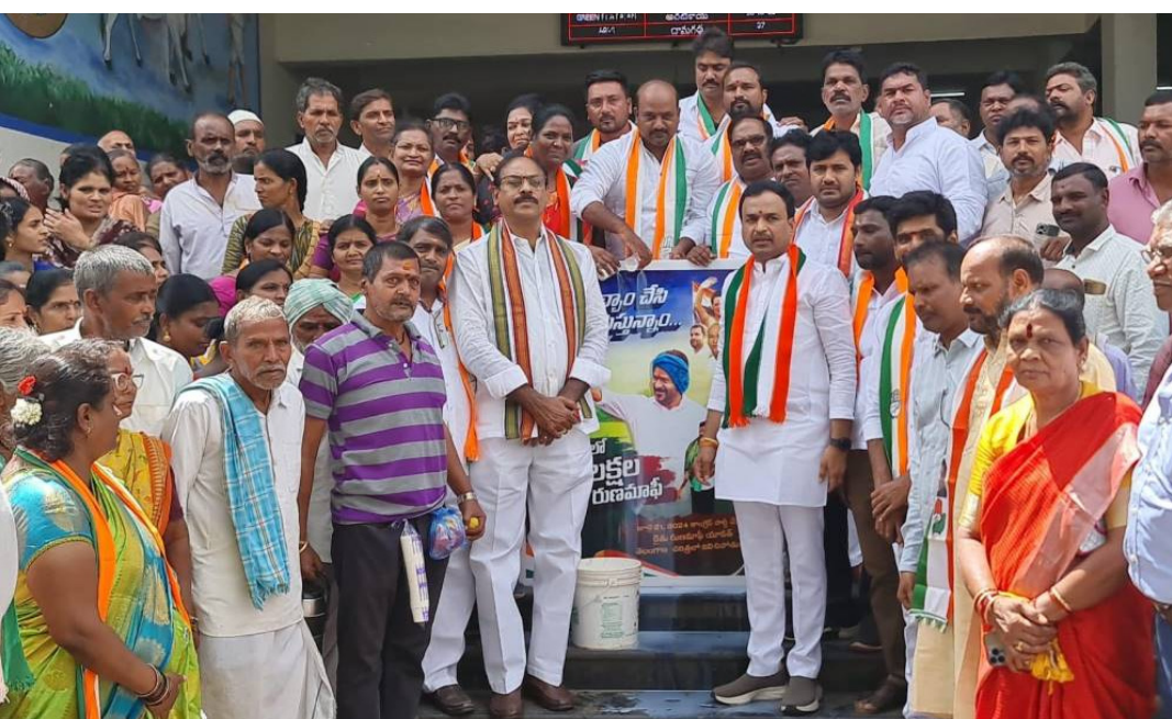
సీఎం రేవంత్ రెడ్డి చిత్రపటానికి క్షీరాభిషేకం చేస్తున్న కాంగ్రెస్ నాయకులు