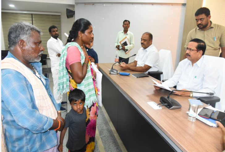
ప్రజావాణిలో అదనపు కలెక్టర్ వెంకటేశ్వర్లు సమస్యను వివరిస్తున్న మహిళ

ప్రజావాణి కార్యక్రమంలో వచ్చిన ప్రతి దరఖాస్తును ప్రాధాన్యత క్రమంలో పరిష్కరించాలని జిల్లా అదనపు కలెక్టర్ (రెవెన్యూ) మునిసి వెంకటేశ్వర్లు అధికారులకు సూచించారు.