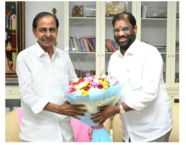
రాజ్యసభలో బి.ఆర్.ఎన్. పార్లమెంటరీ పార్టీ డిప్యూటీ లీడర్ తనకు ఎంపిక చేసిన నేపథ్యంలో పార్టీ అధినేత కేసీఆర్ ను సోమవారం ఎర్రవెళ్లిలోని వారి నివాసంలో కలిసి దర్శనాన్ని తెలిపిన ఎంపీ వర్గరాజు రవిచంద్ర

రంగారెడ్డి సంపుటి : 01 సంచిక : 340 పేజీలు : 4 వెల : 4/- మంగళవారం • 25, జూన్ 2024 ఎడిటర్ : ఎం.వనితారెడ్డి