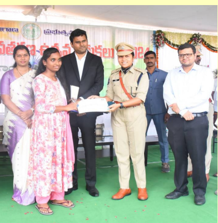
నియమించి పర్యవేక్షణ చేయించేందుకు ప్రణాళికలు రూపొందిస్తున్నట్లు తెలిపారు. సబ్జెక్టు డీచర్ల కొరత

పిల్లలను బడిలో చేర్చించడమే కాక బాల కార్యక్రమ వ్యవస్థను సమూలంగా నిర్మూలించేందుకు ప్రత్యేక కార్యాచరణతో ముందుకు వెళుతున్నట్లు చెప్పారు. జిల్లా స్థాయి అధికారులను ఆయా ప్రభుత్వ పాఠశాలలకు ఇప్పటి నుంచే ప్రత్యేక అధికారులుగా