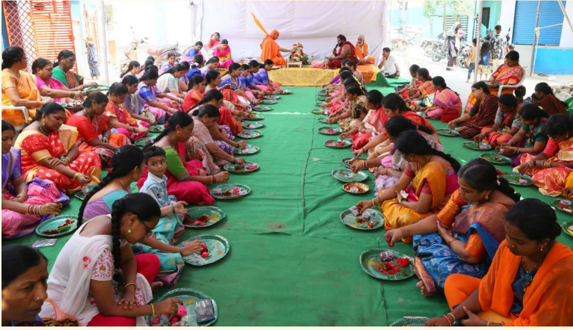
ఆలయంలో సామాహిక కుంకుమార్చన పూజలు చేస్తున్న మహిళలు