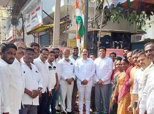
సాగుతున్నదని సంక్షేమ, అభివృద్ధి కార్యక్రమాలు కొనసాగుతున్నాయని, రాష్ట్రంలో ప్రజాపాలన దిశగా ముఖ్యమంత్రి, మంత్రులు, నాయకులు కృషి చేస్తున్నారని అన్నారు. ఈ కార్యక్రమంలో శేరిలింగంపల్లి నియోజకవర్గం కాంగ్రెస్ పార్టీ పెద్దలు, కంటెస్టెడ్ కార్పొరేటర్లు, డివిజన్ అధ్యక్షులు, డివిజన్ ఇన్చార్జులు, డె.నారిట్ సోదరులు, మహిళా సోదరిమణులు, యువ నాయకులు, యాత్ కాంగ్రెస్ నాయకులు, ఎన్ ఎస్ యువ నాయకులు, సీవార్డీ నాయకులు మరియు కాంగ్రెస్ పార్టీ కార్యకర్తలు భారీ ఎత్తున పాల్గొన్నారు.