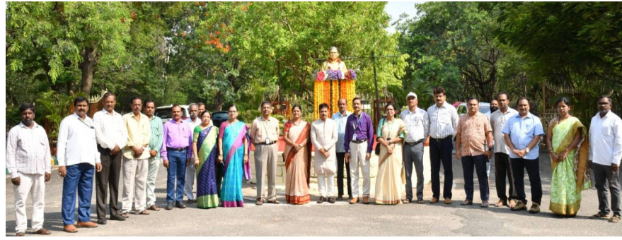
ప్రాఫెసర్ జయశంకర్ విగ్రహం వద్ద వ్యవసాయ విశ్వవిద్యాలయం ఉన్నతాధికారులు, ఉద్యోగులు