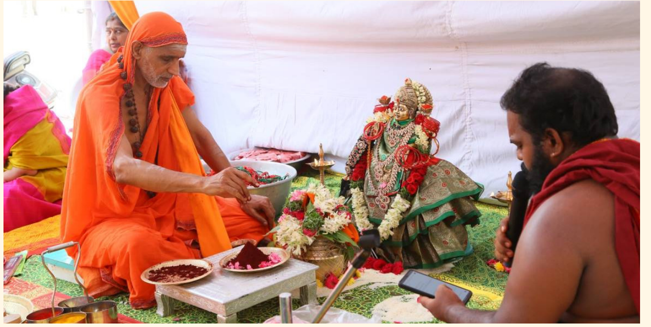
అమ్మవారి ఆలయ వార్షికోత్సవ కార్యక్రమంలో పూజలు చేస్తున్న స్వామిజీ