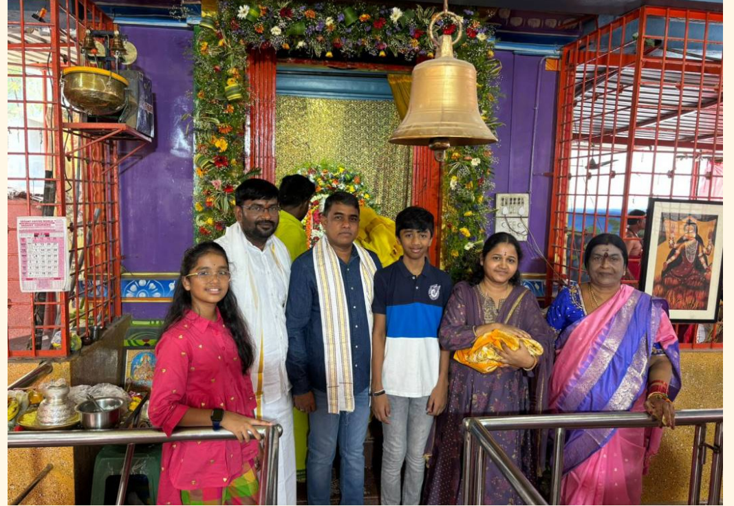
అమ్మవారిని దర్శించుకున్న ఇన్స్పెక్టర్ నరసింహ