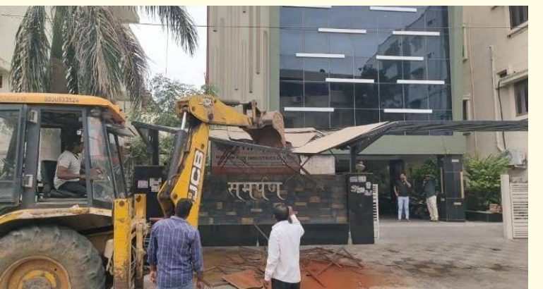
అత్యధిక అంబియెన్స్ ఫోన్ గేటు ముందు వేసిన షెడ్యూ ను తొలగిస్తున్న రాజేంద్రనగర్ టౌన్ ప్లానింగ్ అధికారులు