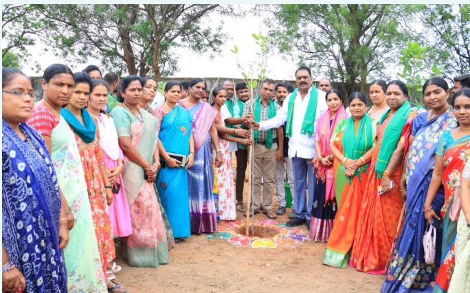
శంషాబాద్ పట్టణంలో మొక్కలు నాటుతున్న ఎమ్మెల్యే ప్రకాష్ గౌడ్

శంషాబాద్, జూలై 9(నమస్తే ఉదయం): వాతావరణ పరిరక్షణ కోసం స్వచ్ఛమైన గాలి కోసం ప్రతి ఒక్కరూ మొక్కలను నాటి వాటిని సంరక్షించడానికి ముందుకు రావాలని రాజేంద్రనగర్ ఎమ్మెల్యే ప్రకాష్ గౌడ్