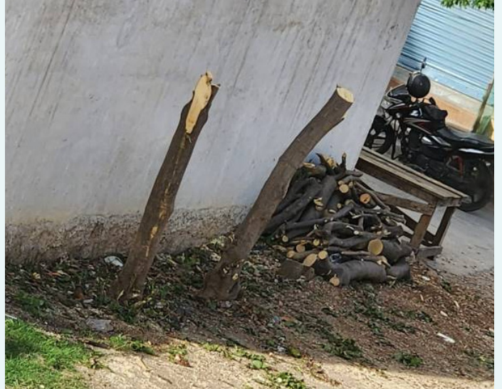
హరితహారంలో నాశనం చేసిన చెట్లను నరికివేత

గత ప్రభుత్వం ప్రతిష్ఠాత్మకంగా చేపట్టిన హరితహారం పథకంలో అధికారులు తమ టార్గెట్ ను పూర్తి చేయాలనే ఆత్రుతతో నాశనం చేసిన చెట్లను నేడు ఆ చెట్లను నరికి వేస్తుండడంతో ప్రభుత్వ ఖజానాకు గండితోపాటు లక్షల నీరుగారుతోందని విమర్శలు