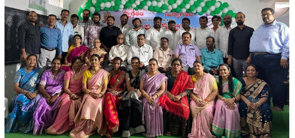
98-99 విద్యార్థుల సమ్మేళనం