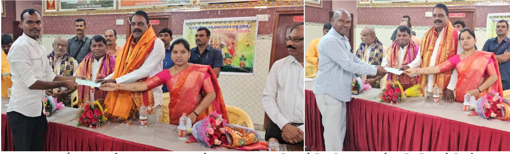
ఆలయ కమిటీ ప్రతినిధులకు బోనాల ఉత్సవాల చెక్కులను అందజేస్తున్న తెలంగాణ రాష్ట్ర హైనాన్స్ కార్పొరేషన్ చైర్మన్ రాజయ్య, ఎమ్మెల్యే ప్రకాష్ గౌడ్, కార్పొరేటర్ సంగీత