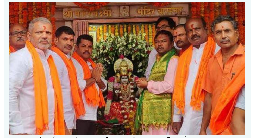
పాతబస్సు భాగ్యలక్ష్మి ఆలయంలో పూజలు చేస్తున్న ప్రశాన్త కమిటీ ప్రతినిధులు

అభ్యుత్థానికి కాంగ్రెస్ కృషి చేస్తోంది. వైఎస్ఆర్ హయాంలో బలహీన పర్లా కోసం ఫీజు రీయింబర్స్ మెంట్ తీసుకొచ్చారు. ఫీజు రీయింబర్స్ మెంట్ ను ముందుకు తీసుకెళ్లేందుకు మా ప్రభుత్వం కట్టుబడి ఉంది. ప్రభుత్వ భూముల్లో తాటి, ఈత చెట్లు పెంచేలా చర్యలు చేపట్టేందుకు మాకు ఎలాంటి అభ్యంతరం లేదు. రాష్ట్రంలో వనమహాభ్యవంతో భాగంగా తాటి, ఈత చెట్ల పెంపకం చేపట్టాలని మంత్రి జూపల్లికి సూచిస్తున్నా చెరువు గట్టుపై కూడా చెట్లు నాటాలి. ఇంగ్లీషు విభాగంలో మాట్లాడాలని మంత్రి శ్రీధర్ బాబుకు సూచిస్తున్నా రహదారులు, చెరువుగట్టు, కాలువగట్టు వద్ద తాటి, ఈత చెట్లు పెంచేలా చర్యలు తీసుకుంటాం. గౌడలను కులవృత్తిని కాపాడేందుకు ప్రభుత్వం కట్టుబడి ఉంది. కులవృత్తులపై ఆధారపడిన నోదరులకు విజ్ఞప్తి చేస్తున్నా. మి పిల్లలను ఉన్నత చదువులు చదివించండి. వాళ్లను ఉన్నతాధికారులుగా తీర్చి దిద్దండి. తెలంగాణ రాష్ట్ర పునర్నిర్మాణంలో వారు భాగస్వాములు కావాలి. చట్టాలు రూపొందించే స్థాయికి మి పిల్లలు ఎదగాలి. బలహీన పర్లాలు పాలకులుగా మారాలంటే ఏకైక మార్గం చదువు మాత్రమే. త్వరలోనే హయత్ నగరం మెట్లో రాబోతుంది. ఇందుకు సంబంధించి అన్ని ప్రణాళికలు పూర్తయ్యాయి. ఫార్మా కంపెనీల కోసం సేకరించిన భూమిలో వివిధ యూని పర్సన్లను, మెడికల్ టూరిజం, పరిశ్రమల ఏర్పాటు చేసేలా ప్రణాళికలు రూపొందిస్తున్నాం. న్యూయార్కు నగరంతో పోటీ పడేలా మహేశ్వరంలో ఒక అద్భుతమైన నగరం నిర్మించే బాధ్యత ప్రభుత్వం తీసుకుంటుంది. ఊటీ కంటే అద్భుతమైన రావకొండ ప్రాంతాన్ని ఫిల్మ్ ఇండస్ట్రీకి అణచుగా మార్చబోతున్నాం. రంగారెడ్డి జిల్లాకు మహారాజ రాజోకోంది.