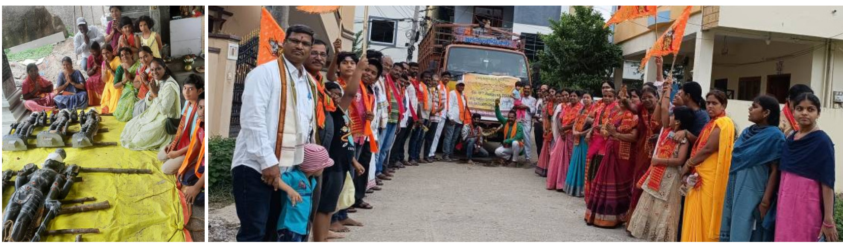
ప్రతిష్ఠాపన శ్రీ సీతారామ లక్ష్మణ అంజనేయ స్వామి విగ్రహాల వద్ద భక్తులు, శ్రీ సీతారామ విగ్రహాలను ఊరేగింపుగా తీసుకెళ్తున్న కాలనీవాసులు