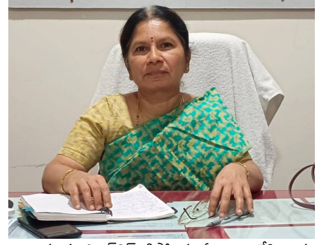
జిల్లా సందు ఓఆర్ఎస్ డివీఎస్ ఏర్పాటు చేసి ఆత్మ పసర మందులతో ఇంటింటి సీవర్ సర్వీ చేస్తున్నారని తెలిపారు. మరియు జిల్లా వైద్య ఆరోగ్యశాఖ సిబ్బంది ఆశా కార్యకర్తలు, ప్రాథమిక ఆరోగ్య కేంద్రంలో ఉన్న వైద్యాధికారులు సిబ్బందితో ఎవనిఎంబు, హెల్త్ నూనర్వైజర్లతో, ఎప్పటికప్పుడు పర్యవేక్షణ చేసి, ఎవరికైనా వైద్యము సందు ఇబ్బందులు ఉన్న వారిని తక్షణమే 108 సహాయంతో జిల్లాకు పంపాలని తెలిపారు.