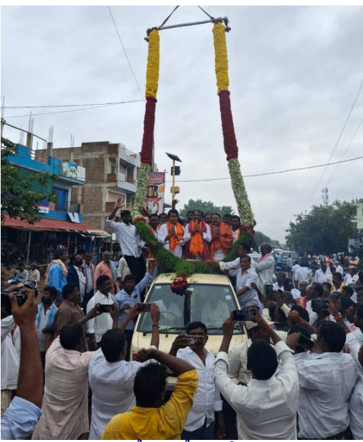
గజమాలతో ఎమ్మెల్యేలను స్వాగతించు వాల్మీకి సభకు ప్రతినిధులు

నిర్వహించిన ప్రజా వాణి కార్యక్రమానికి ప్రజల నుండి 48 ఫిర్యాదులు అందాయి. జిల్లాలోని వివిధ ప్రాంతాల నుండి వచ్చిన ఫిర్యాదు దారులు అందజేసిన అధికారులను జిల్లా కలెక్టర్ బి.యం. సంతోష్, అదనపు కలెక్టర్ మునిసి వెంకటేశ్వరులు, సర్కిలారావులతో కలిసి స్వీకరించారు. ఈ సందర్భంగా కలెక్టర్ బి.యం.సంతోష్, ప్రతి నోమవారం ప్రజావాణి కార్యక్రమం ద్వారా ప్రజా సమస్యల పరిష్కారం కోసం వచ్చిన దరఖాస్తులను ఎప్పటికీ అప్పుడు పరిష్కరించాలని తెలిపారు. ఈ కార్యక్రమంలో వివిధ శాఖల జిల్లా అధికారులు తదితరులు పాల్గొన్నారు.