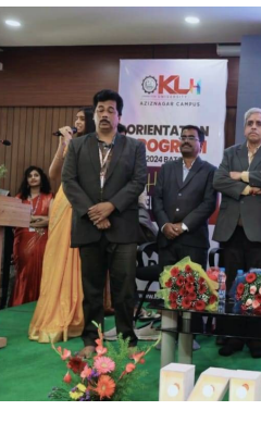
మొయినాబాద్ జూలై 15 (సమస్త ఉదయం):