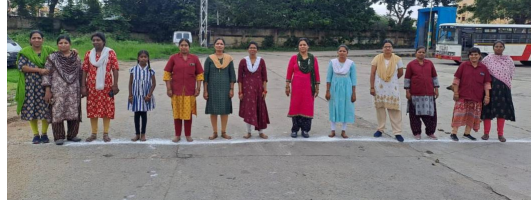
పోటీలలో పాల్గొన్న మహిళా కాండక్టర్లు, రాజేంద్రనగర్ ఆర్టీసీ బస్సు డిపో ఉద్యోగుల ఆనందం