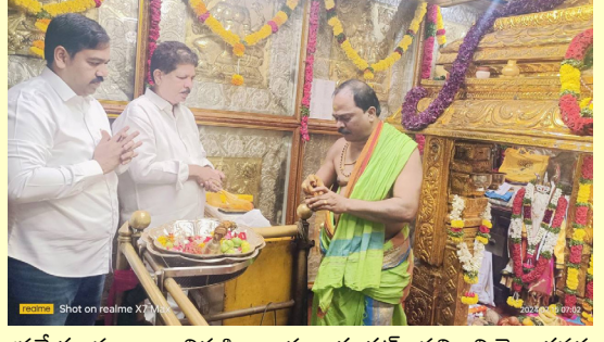
ప్రత్యేక పూజలు నిర్వహించారు. కూకట్ పల్లి నియోజకవర్గ ప్రజలందరూ సుఖ సంతోషాలతో, ఆప్టేషన్లతో ఉండాలని ఆ తల్లిని వేడుకున్నారు.