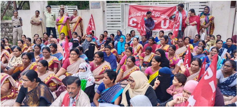
రాజేంద్రనగర్ ఎమ్మెల్యే క్యాంపు కార్యాలయం ముందు బైలాంబింగ్ అంగన్వాడీ తీవ్రస్థ, పర్యర్థ