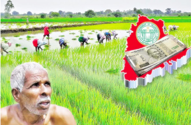
అన్ని వాణిజ్య బ్యాంకులు, గ్రామీణ బ్యాంకులు, జిల్లా సహకార బ్యాంకులు సువిధంగా ఈ కాలంలో రుణాలు తీసుకుంటే వారికి కూడా రుణమాఫీ వర్తింపనుంది. వ్యవసాయశాఖ కమిషనర్, సంచాలకులు (డీఓ) పంట రుణమాఫీ 2024 పథకాన్ని అమలు చేస్తారు. హైదరాబాద్లో గల నేషనల్ ఇన్ఫర్మేటిక్స్ సెంటర్ (ఎన్ఐఐసీ) ఈ పథకానికి భాగస్వామిగా ఉంటుంది. వ్యవసాయశాఖ సంచాలకులు, ఎన్ఐఐ కలిసి ఐటీ పోర్టల్ నిర్వహిస్తారు. ఆ పోర్టల్లో ప్రతి రైతు కుటుంబానికి సంబంధించిన లోన్ అకౌంట్ డేటా సేకరణ, డేటా వాలిడేషన్, అర్హత మొత్తాన్ని నిర్ణయించడానికి సౌకర్యం ఉంటుంది. పథకం అమలు కోసం ప్రతి బ్యాంకులోనే ఐఎఫ్ఎంఐఎస్ పోర్టల్ కి బిల్లులు సమర్పించడం, పథకానికి సంబంధించిన భాగస్వామితో సమాచారం పంచుకోవడం, రైతుల ఇచ్చే ఫిర్యాదుల పరిష్కారానికి ప్రత్యేకమైన మార్కెట్లను ఏర్పాటు చేయాలి అమలు చేస్తారు. బ్యాంకులో ఒక అధికారిని బ్యాంకుకు ప్రత్యేక అధికారిగా (బీఎస్) నియమిస్తారు. బ్యాంకు నోడల్ అధికారి బ్యాంకులకు వ్యవసాయశాఖ సంచాలకులు, ఎన్ఐఐ మధ్య సమన్వయకర్తగా వ్యవహరిస్తారు. బ్యాంక్ నోడల్ అధికారులు తమ సంబంధిత బ్యాంక్ యొక్క పంట రుణాల డేటాను డిజిటల్ సంతకం చేయాల్సి ఉంటుంది.