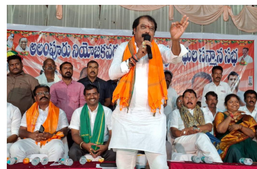
సభలో మాట్లాడుతున్న ఎమ్మెల్యే పార్లమెంటు, మాట్లాడుతున్న గుంతకల్ ఎమ్మెల్యే జయరాములు