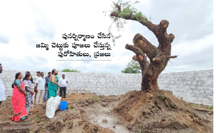
పునర్నిర్మాణం చేసిన జమ్మి చెట్టుకు పూజలు చేస్తున్న పురోహితులు, ప్రజలు