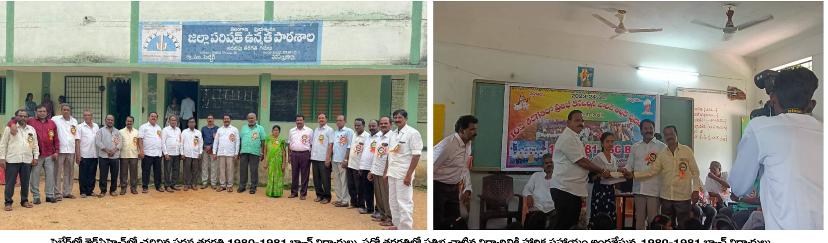
పెద్దెలో జైవహార్లో చదివిన పదవ తరగతి 1980-1981 బ్యాచ్ విద్యార్థులు, పదో తరగతిలో ప్రతిభ చావిన విద్యార్థినికీ హార్దిక సహాయం అందజేస్తున్న 1980-1981 బ్యాచ్ విద్యార్థులు

తెలిపారు. జిల్లాలోని బ్యాంకులు, సహకార శాఖ ద్వారా రైతులకు నేరుగా వారి ఖాతాలలో రుణమాఫీ సొమ్ము జమవుతుందని అన్నారు. గ్రామ, మండల, జిల్లా స్థాయిలలో వ్యవసాయ శాఖ బ్యాంకులతో కలిసి కమిటీలను ఏర్పాటు చేస్తామని అన్నారు.