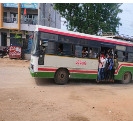
రద్దీతో వెళ్తున్న ఆర్టీసీ బస్సు, బస్సు లేకపోవడంతో కాలిపడకతో వెళ్తున్న విద్యార్థులు

పాఠశాలకు, కళాశాలకు వెళ్ళే విద్యార్థులకు ఆర్టీసీ బస్సులు లేక అవస్థలు పడుతున్నాయి. కొందరు విద్యార్థుల కిల్లో మీటర్ ల మేర కాలిపడకన నడుచుకుంటు పాఠశాలకు వెళ్ళుతారు. ధర్మార మండల కేంద్రంలో గల జెడ్పీ హెచ్ఎస్, ప్రభుత్వ జూనియర్ కళాశాలకు కొండాపురం, మైలగడ్డ, అల్వూల్ పాడు, కోతుల గిద్ద, కొత్తపాలెం, జాంపల్లి గ్రామాల నుంచి పంపాలడి మంది విద్యార్థులు విద్యనభ్యసిస్తున్నారు. రాయచూరు నుంచి గద్వాలకు వెళ్ళే మార్గంలో ధర్మార మండల కేంద్రానికి పాఠశాల, కళాశాల సమయాల్లో తగినన్ని ఆర్టీసీ బస్సులు లేకపోవడంతో ప్రమాదమని తెలిసినా విద్యార్థులు బస్సులకు వేలాడుతూ ప్రయాణం సాగిస్తున్నారు.