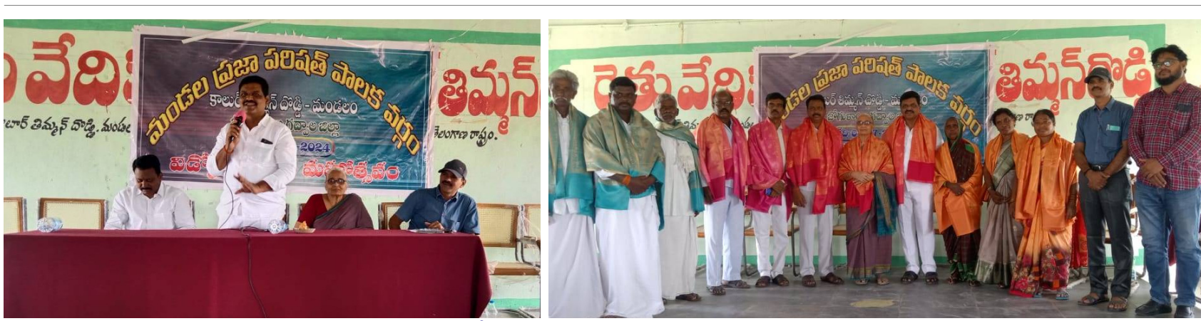
కార్యక్రమంలో ప్రసంగిస్తున్న ఎంపీడివో, పదవీకాలం ముగిసిన ప్రజాప్రతినిధులను సన్మానించిన అధికారులు

విద్యార్థులు బస్సు కిరీటీలు, డోరు వద్ద వేలాడుతూ ప్రయాణం చేస్తున్నారు. బస్సు సర్వీసులు పెంచాలని గతంలో పలుమార్లు అధికారులకు వినవించినా ఫలితం లేదు. ఇప్పటికైనా సంబంధిత శాఖ అధికారులు ఈ మార్గాల్లో బస్సు సర్వీసులను పెంచాలని విద్యార్థులు, ప్రయాణికులు కోరుతున్నారు. 00