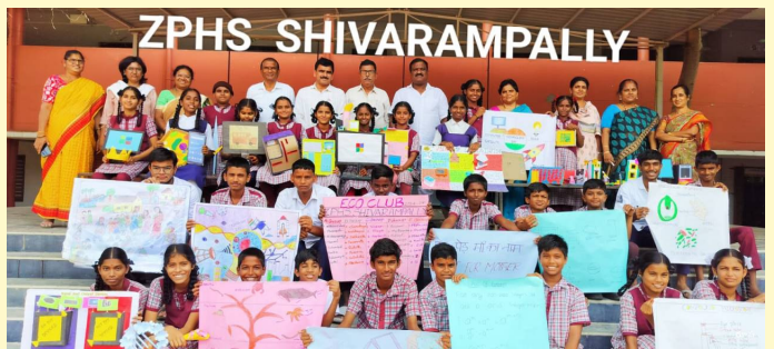
శివరాంపల్లి జిల్లా పరిషత్ ఉన్నత పాఠశాలలో జరిగిన శిక్షా సప్తాహ కార్యక్రమంలో పాల్గొన్న విద్యార్థులు, ఉపాధ్యాయులు

శేంద్ర ప్రభుత్వం జాతీయ విద్యావిభాగం నాలుగో రాష్ట్రకోశవనం పూర్తవుతున్న సందర్భంగా ఈ నెల 22 నుంచి 28 వ తేదీ వరకు వారికి రోజుల పాటు రంగారెడ్డి జిల్లాలోని అన్ని ప్రభుత్వ పాఠశాలలో శిక్షా సప్తాహ కార్యక్రమాన్ని నిర్వహించేందుకు జిల్లా విద్యాశాఖ రూపొందించిన ప్రత్యేక కార్యచరణ మంగళవారం ముగిసింది.