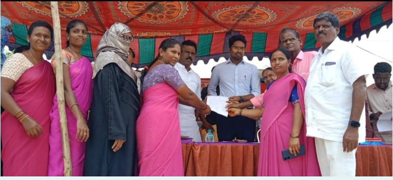
కలెక్టర్ కు వినతిపత్రం అందజేస్తున్న ఆర్పిఐలు