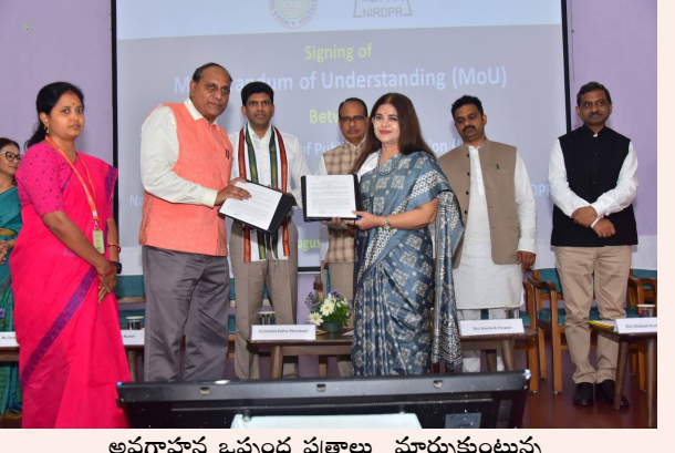
అవగాహన ఒప్పంద పత్రాలు మార్చుకుంటున్న ఎన్ఆర్ఐ డి డిఆర్ - జె ఎస్ యు ఉన్నతాధికారులు