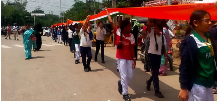
200 మీటర్ల జాతీయ జెండాతో తిరంగా ర్యాలీ లో పాల్గొన్న పల్లవి స్కూల్ విద్యార్థులు, ఉపాధ్యాయులు