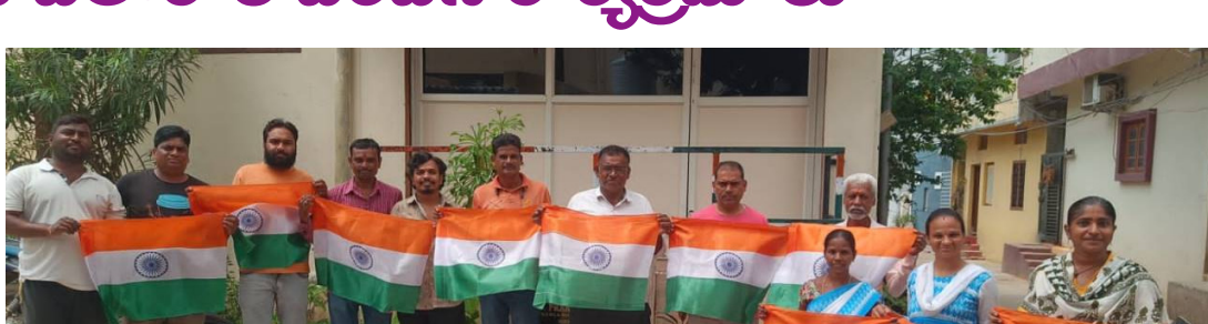
శివరాంపల్లిలో జాతీయ పతాకాలను పంపిణీ చేస్తున్న నవ యువ యువజన సంఘం సభ్యులు

రాజేంద్రనగర్, ఆగస్టు 13(నమస్తే ఉదయం): హర్ ఘోర్ తిరంగా కార్యక్రమంలో భాగంగా ప్రజలలో అవగాహన కల్పించడానికి పల్లవి స్కూల్ విద్యార్థులు మంగళవారం 200 మీటర్ల జాతీయ జెండాను చేత పట్టుకొని ర్యాలీ నిర్వహించారు. వీడివీ చౌరస్సా నుంచి ఉప్పర్ పల్లి, హైదర్ గూడ మీదుగా అత్తాపూర్ వరకు ర్యాలీ కొనసాగింది. వందలాది మంది విద్యార్థులు, ఉపాధ్యాయులు ర్యాలీలో పాల్గొన్నారు. ఈ నెల 15న ప్రతి ఒక్కరు స్వాతంత్ర్య దినోత్సవ వేడుకలలో పాల్గొనాలని విజ్ఞప్తి చేశారు.