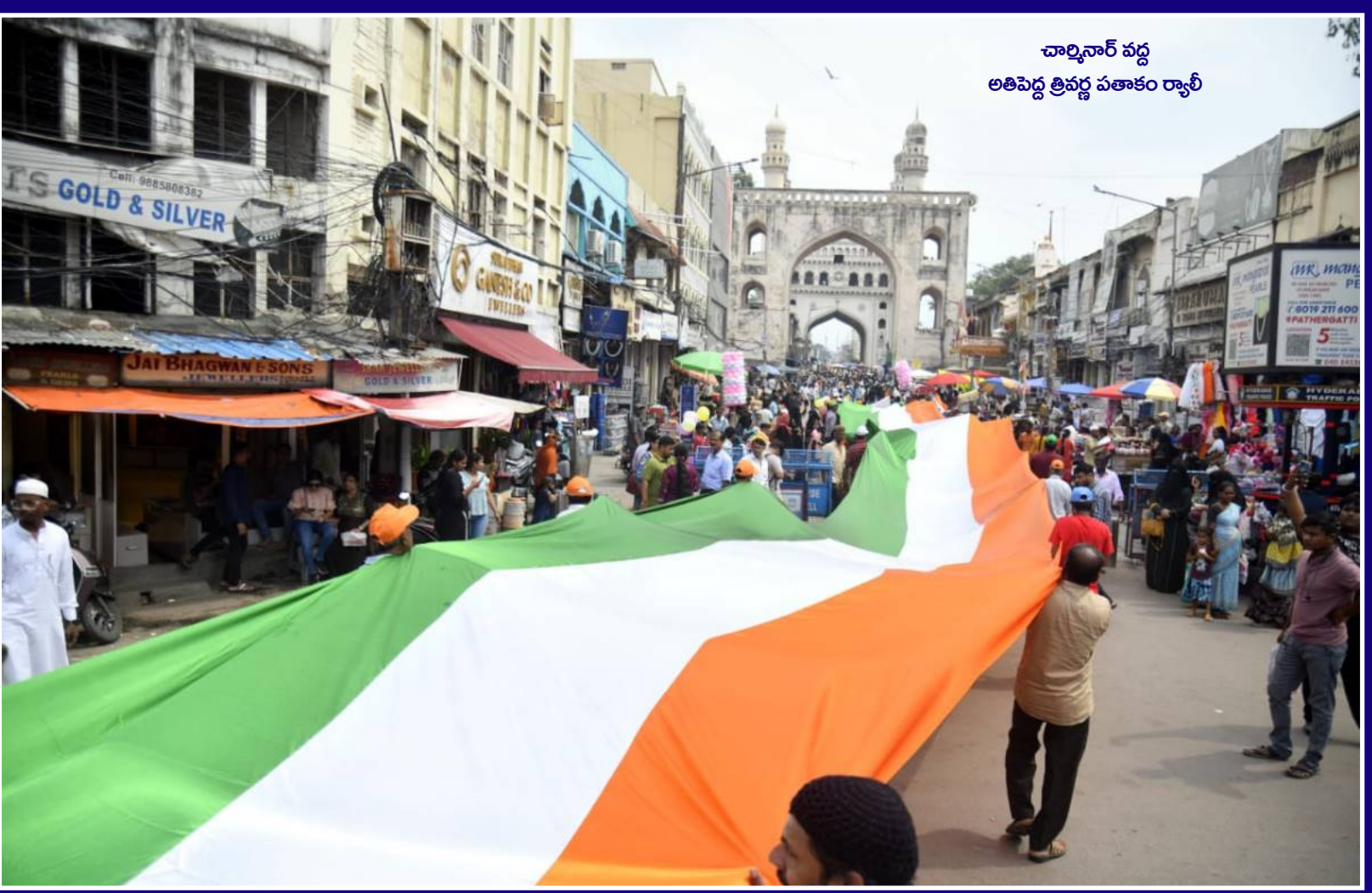
చార్లినార్ వద్ద అతిపెద్ద తిరవ్వు పతాకం ర్యాలీ