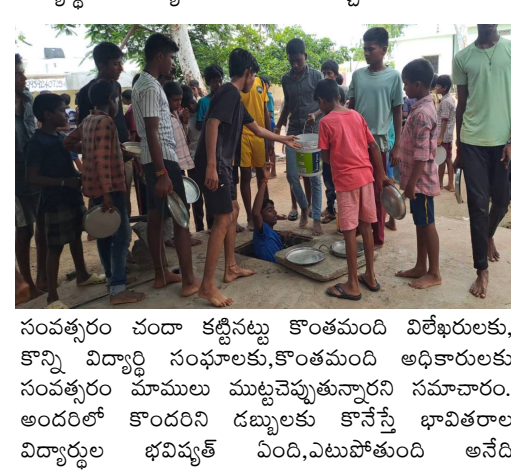
సంవత్సరం చందా కట్టినట్లు కొంతమంది విలేకరులకు, కొన్ని విద్యార్థి సంఘాలకు, కొంతమంది అధికారులకు సంవత్సరం మాములు ముట్టచెప్పుతున్నారని సమాచారం. అందరిని డబ్బులకు కొనేస్తే భావితరాల విద్యార్థుల భవిష్యత్ ఏంది, ఎటుపోతుంది అనేది

రంగంలోకి దిగి విలేకర్లను సంధి చేశారే పనిలో ఉన్నారు. దొంగలు, దొంగలు కలిసి గట్టు పంచుకున్నట్లు ఇలా హాస్టళ్ల పరిశీలనకు వచ్చిన అందరిని డబ్బులతో కొనేస్తే హాస్టల్ విద్యార్థుల సమస్యలు బయటకు వచ్చేదెలా?... పేపర్ కి