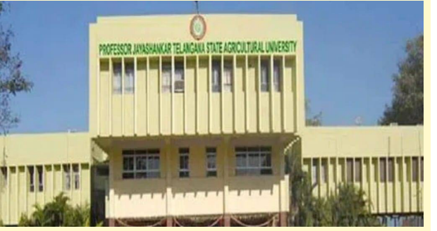
వ్యవసాయ విశ్వవిద్యాలయం పరిపాలన భవనం విద్యవిధానాలు అర్హత ప్రమాణాలు సీట్ల వివరాలు, ఇతర సమాచారం కొరకు అభ్యర్థులు యూనివర్సిటీ వెబ్సైట్ www.pjtsau.edu.in సంప్రదించగలరని తెలియజేశారు.