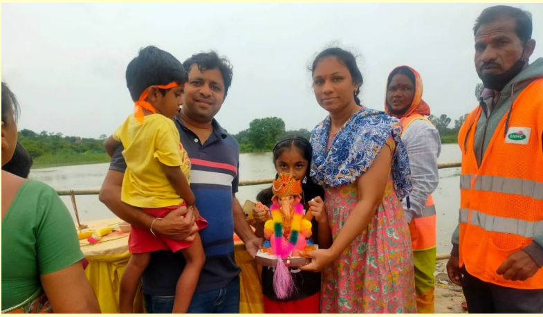
పత్తికుంటలో వినాయకుని నిమజ్జనం చేయడానికి కుటుంబ సమేతంగా వచ్చిన భక్తులు