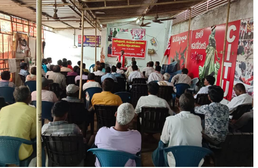
పారిశ్రామిక ప్రాంతంలో ఇంద్రప్రస్థ ఏరియా స్థలం కాసీ ప్రభుత్వ స్థలం ఉన్న ప్రాంతంలో వర్కనెట్ గా భవన నిర్మాణ కార్మికులకు షెడ్యూల్ ఏర్పాటు చేసి బాట్రూం వసతి కల్పించి

ఏర్పాటు చేయాలి ప్రస్తుతానికి కాటేడాన్ స్వస్థ ధియేటర్ ముందు కార్మికులందరూ తమ పని కోసం నిలబడుతుంటే అక్కడ ఉన్న ఫాష, ధియేటర్ యజమానులు ఇక్కడ నిలబడదని దుర్గావలూరు నెట్టి వేస్తున్నారు. ఈ ప్రాంతానికి సంబంధించిన ప్రభుత్వ అధికారులు కాటేడాన్