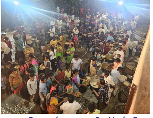
హైదర్ గూడ వివేకానంద యాత్ర అసోసియేషన్ అధ్వర్యంలో ప్రతిష్టించిన గణాధుని సన్నిధిలో అన్న దాన కార్యక్రమంలో పాల్గొన్న భక్తులు

హైదర్ గూడ బస్ స్టేజీలో వినాయక నవరాత్రి ఉత్సవాలు కనుల పండుగ జరుగుతున్నాయి. వివేకానంద యాత్ర అసోసియేషన్ అధ్వర్యంలో ఏర్పాటుచేసిన వినాయకుని మండపంలో సోమవారం సాయంత్రం భక్తి క్రైడలతో హుజులు చేశారు. భజనలు చేసి వినాయకుని కి తమ భక్తిని చాటు కున్నారు. అనంతరం అన్నదాన కార్యక్రమం నిర్వహించారు. వందల సంఖ్యలో భక్తులు అన్నదాన కార్యక్రమంలో పాల్గొన్నారు.