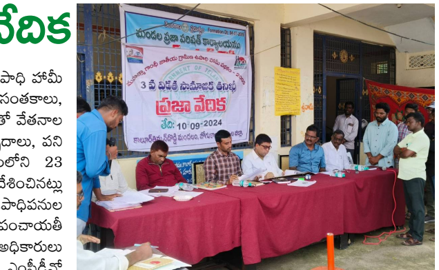
పంచాయతీ కార్యదర్శులు, సామాజిక తనిఖీ బృందం సభ్యులు, ఉపాధి హామీ సిబ్బంది పాల్గొన్నారు.