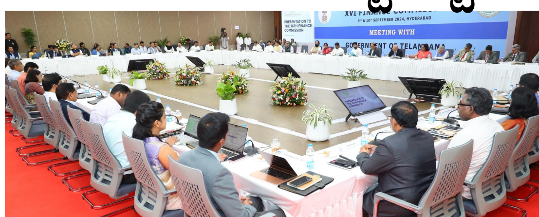
అవకాశం ఉందన్నారు. ఇది తెలంగాణ డిమాండ్ కాదని.. అన్ని రాష్ట్రాలకు సంబంధించినదని పేర్కొన్నారు. తెలంగాణ ప్రత్యేక రాష్ట్రమని... చారిత్రిక కారణాల వల్ల అసమాన అభివృద్ధి ఇక్కడ ఉన్నదని భట్టి విక్రమార్కు పేర్కొన్నారు. తలసరి ఆదాయం ఎక్కువ ఉన్నప్పటికీ

డిప్యూటీ సీఎం, ఆర్థిక మంత్రి మల్లు విక్రమార్కు 16వ ఆర్థిక సంవత్సారం కోరారు. నేడు ప్రజా భవన్ లో నిర్వహిస్తున్న 16వ మైనాస్ కమిషన్ సమావేశంలో భట్టి మాట్లాడుతూ.. పన్నుల నుంచి తెలంగాణకు వచ్చే ఆదాయం వాటాను 41శాతం నుంచి 50శాతానికి పెంచాలని కోరారు. రైతు భరోసా, రైతు రుణమాఫీ రాష్ట్రానికి జీవరథ లాంటివి.. ఈ రాష్ట్ర ప్రజలకు ఆర్థిక భరోసాలు, అధిక భద్రతను కల్పిస్తున్నాయి. కేంద్ర పథకాలను వినియోగించుకోవాలంటే తరచూ కఠినమైన నిబంధనలు విధిస్తున్నారు. ఫలితంగా కేంద్ర ప్రయోజిత పథకాలను పొందడంలో రాష్ట్రాలు ఇబ్బందులను ఎదుర్కొంటున్నాయన్నారు. రాష్ట్రాలు తమ అవసరాలు కనుగుణంగా కేంద్ర ప్రభుత్వ పథకాలను రూపొందించడానికి స్వయం ప్రతిపత్తిని అందించాలని భట్టి కోరారు. తెలంగాణ రాష్ట్రం కీలక దశలో ఉన్నదని.. వేగంగా అడుగులు వేస్తోందన్నారు. గత ఆర్థిక సంవత్సరం ముగిసినాటికి 6.85 లక్షల కోట్లకు పైగా రుణభారంతో సతమతం అవుతున్న దన్నారు. సెన్లు, సర్ చార్జిల్లో రాష్ట్రాలకు వాటా ఇవ్వాలన్నారు. స్థూల పన్ను ఆదాయంలో రాష్ట్రాల వాటా తక్కువగా ఉన్నదని పేర్కొన్నారు. సంక్షేమ కార్యక్రమాలను బలోపేతం చేయడం మౌలిక సదుపాయాల కల్పన ద్వారా అంతరాలను పరిష్కరించడానికి