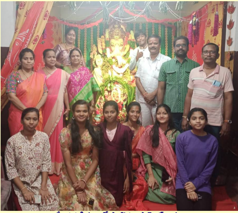
విఘ్నేశ్వరుడి పూజలో పాల్గొన్న అపార్థింట్ వాసులు