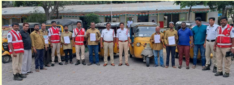
డ్రైవర్లకు లైసెన్స్ ఇవ్వాలని ట్రాఫిక్ పోలీసులు