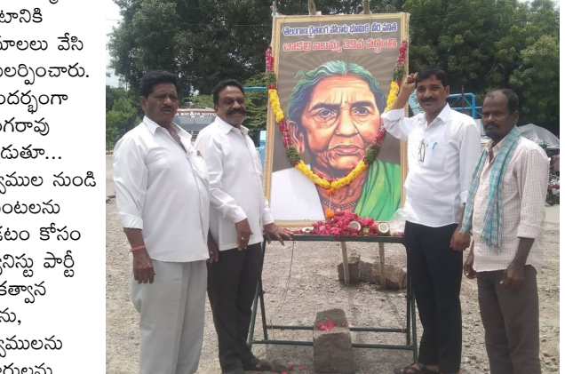
చాకలి ఐలమ్మకు నివాళులర్పిస్తున్న ఏఐటీయూసీ నాయకులు