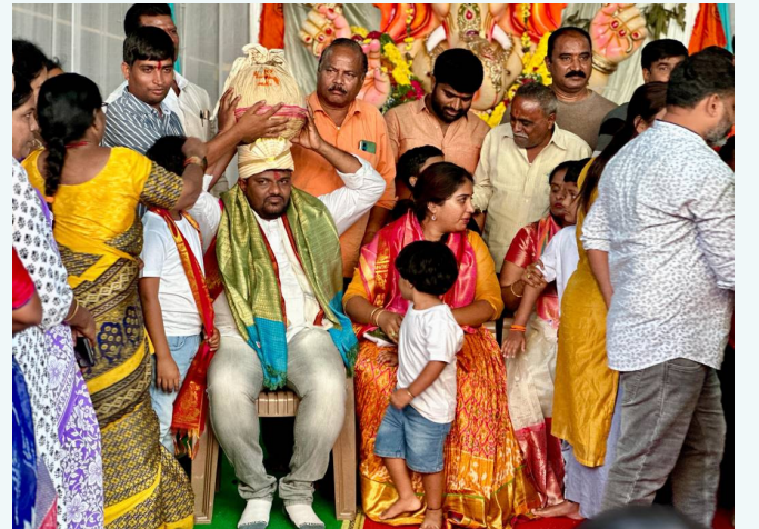
భవానికాలనీలో విఘ్నేశ్వరుడి పూజల్లో కాలనీవాసులు