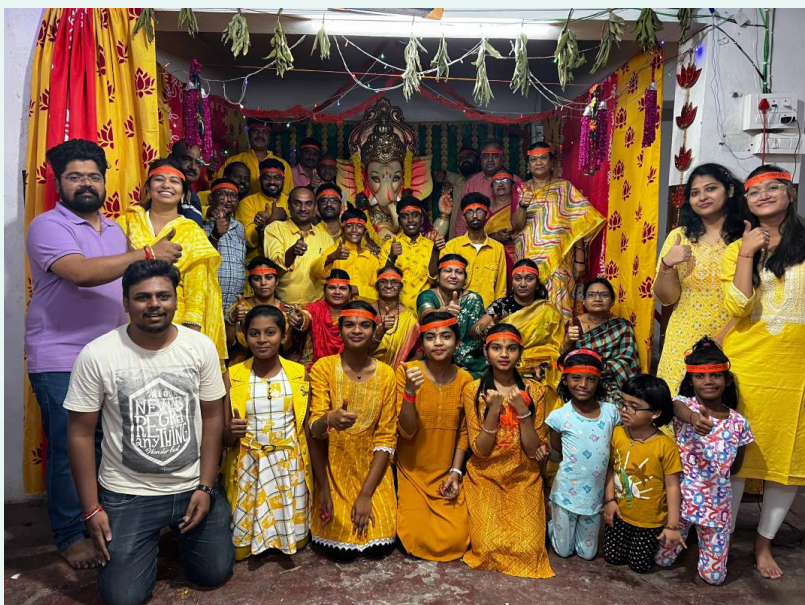
నిమజ్జనానికి సిద్ధమైన ఎస్ జి ఆర్ టవర్స్ గణనాథుడు