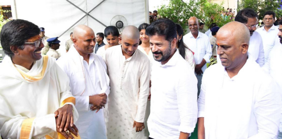
జి.ఎం.ఆర్ కుటుంబ సభ్యులను పరామర్శించిన సీఎం రేవంత్ రెడ్డి