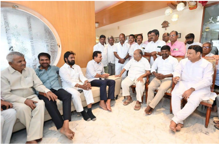
మాజీ మంత్రి నాగం జనార్దన్ రెడ్డిని ఆరోగ్య విషయాలను అడిగి తెలుసుకుంటున్న మాజీ మంత్రి కేటీఆర్, మాజీ మంత్రి నాగంను తోగిలించుకుంటున్న మాజీ మంత్రి కేటీఆర్