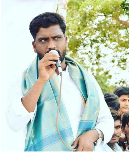
నాయకులు సిగ్గు విడిచి మాట్లాడుతున్నారు. ఇందిరా గాంధీ, రాజీవ్ గాంధీ లాంటి త్యాగాల కుటుంబం గురించి మాట్లాడే

ఆంధ్రప్రదేశ్లో పార్టీ తుడుముకుపెట్టుకోవడం దని తెలిసినా.. తెలంగాణ రాష్ట్రాన్ని ఏర్పాటు చేసిన గొప్ప త్యాగ మూర్తి సోనియాగాంధీ అని తెలిపారు. తెలంగాణ నివాసాన్ని రాజకీయాల కోసం వారుకున్న కొందరు నాయకులు ఇవ్వాలి రాజీవ్ విగ్రహ ఏర్పాటుపై ఇష్టం వచ్చినట్లు మాట్లాడుతున్నారు. 17 స్థానాల్లో 9 చోట్ల డిపాజిట్టు కోల్పోయిన ఆ పార్టీ