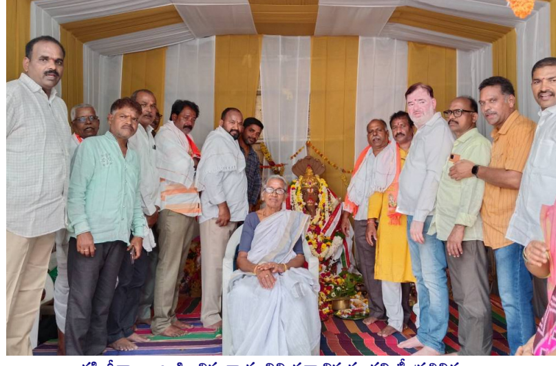
భక్తి గీతాలు ఆలపించిన గాయనిని సన్మానిస్తున్న కమిటీ ప్రతినిధులు