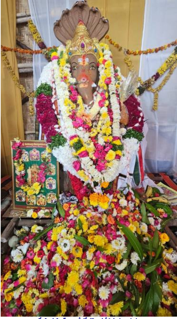
స్నేహిత హిల్స్ కాలనీలో కొలువుదీరిన ఘనాభుడు