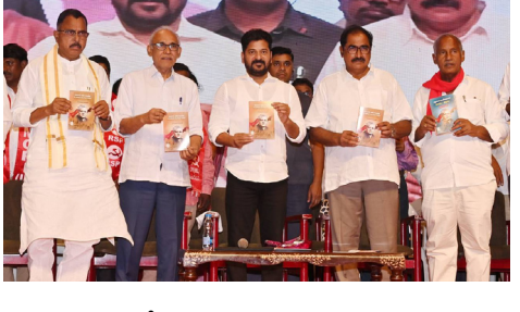
బాధాకరం. సీతారాం ఏచూరి లాంటి వ్యక్తులు చాలా అరుదు. విద్యార్థి దశ నుంచి దేశ క్రియాశీల రాజకీయాల్లో కీలక పాత్ర పోషించారు. ఆయన స్ఫూర్తితో జమిలి ఎన్నికల వ్యతిరేక పోరాటంలో ముందుకు వెళ్ళాలి. రాహుల్ గాంధీపై కేంద్రమంత్రి మాట్లాడితే, ప్రధాని స్పందించకపోవడం వారి ఫ్యామిలీ విధానాలకు నిదర్శనం. అలాంటి భాషా ప్రయోగం చేసిన వారిని నియంత్రించక పోవడం ప్రజాస్వామ్యానికి మంచిది కాదు.

దేశ రాజకీయాల్లో ప్రజాస్వామిక స్ఫూర్తిని రంగిలించి పేదల పక్షం గళం విప్పిన సీతారాం ఏచూరి మరణం తీరని లోటు. ప్రజాస్వామిక వేదికలపై మన కీర్తిని ప్రపంచానికి చాటి గొప్ప వ్యక్తి సీతారాం ఏచూరి. వారిని కలిసి మాట్లాడినప్పుడు కీర్తిశేషులు జైపాల్ రెడ్డి గుర్తొచ్చేవారు. దేశ రాజకీయాల్లో జైపాల్ రెడ్డి సమకాలికుడూ సీతారాం ఏచూరి ఉండేవారు. నమ్మిన సిద్ధాంతం కోసమే చివరి శ్వాస వరకు నిలబడిన వ్యక్తి సీతారాం ఏచూరి. ఆయన ప్రతికూల కాలం పేదల కోసం పోరాడారు. మరణాంతరం కూడా ఉపయోగపడాలన్న చూటుబసభ్యుల నిర్ణయం ఎంతో గొప్పది. యాపిపి పూయాలంటే పేదలకు ఉపయోగపడే కీలక బిల్లులకు మద్దతు తెలపడంలో ఆయన క్రియాశీల పాత్ర పోషించారు. రాహుల్ గాంధీ ఆయన్ను మార్గనిర్దేశకర్తగా భావిస్తారు. జమిలి ఎన్నికల మునుగులో దేశంలో అభివృద్ధి చేలాయించాలన్న కుట్ర జరుగుతోంది. జమిలి ఎన్నికల మునుగులో దేశాన్ని కళాళించాలనుకుంటున్న ఇలాంటి కీలక సమయంలో,