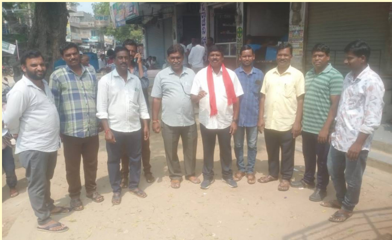
సమావేశమైన భవన నిర్మాణ కార్మికులు