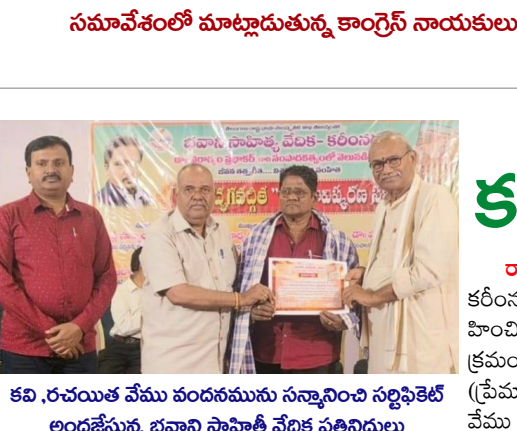
కవి, రచయిత వేము వందనమును సన్మానించిన సర్పంచికే అందజేస్తున్న భవాని సాంస్కృతిక వేదిక ప్రతినిధులు