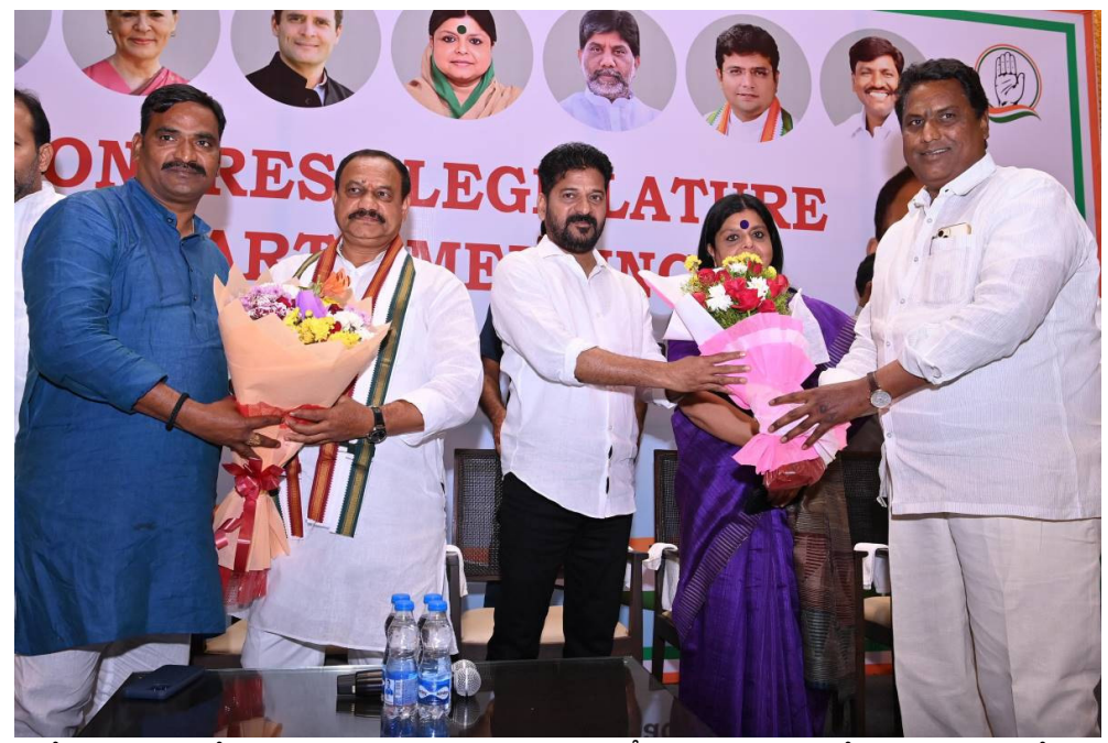
రిజిస్ట్రేషన్ ఇవ్వాలంటే కచ్చితంగా జనాభాను లెక్కించాలి. ఎన్ఐఎ వర్గీకరణ అమలుపై ఉత్తమ కుమార్ రెడ్డి