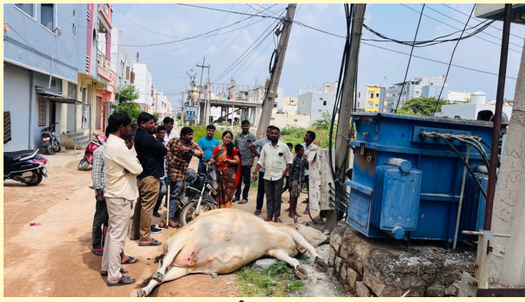
విద్యుత్ పాక్తో మృతి చెందిన ఆవు