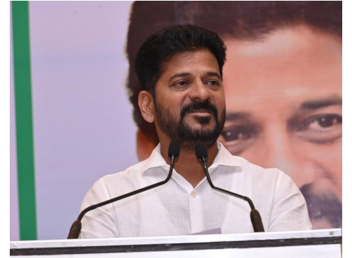
నాయకత్వంలో మంత్రివర్గ ఉప సంచాయితో ఏర్పాటు చేశాం. సుప్రీం కోర్టు తీర్పును పూర్తిగా అధ్యయనం చేసి ఈ

కమిటీ ప్రభుత్వానికి నివేదిక ఇస్తుంది. దేశంపై నాలుగోసారి పట్టు సాధించడానికి మాడీ ప్రయత్నాలు చేస్తున్నాడు. నాలుగో సారి గెలవడం కోసమే ప్రధాని మోడీ జమిలి ఎన్నికలు తీసుకువస్తున్నారు. జమిలి ఎన్నికలపై అభిమానంగా ఉండాలి. తొమ్మిది నెలల్లో ఒక్క రోజు కూడా నేను సెలవు తీసుకోలేదు. ప్రభుత్వం చేపడుతున్న కొత్త కార్యక్రమాలను ప్రజల్లోకి తీసుకెళ్ళాలి. భారతదేశంలో ఏ రాష్ట్ర ప్రభుత్వం 27 రోజుల్లో 18 వేల కోట్ల రైతు రుణమాఫీ చేయలేదు. రైతు రుణ విముక్తి కావడమే ప్రభుత్వ లక్ష్యం. ఫ్యామిలీ డిజిటల్ కార్డు తీసుకురాబోతున్నం. రాష్ట్రంలో ప్రతి ఒక్కరికి హోల్ ప్రొఫైల్ డిజిటల్ కార్డు ఉంటుంది. రాష్ట్రంలో ఎక్కడున్నా రేషన్ తీసుకునే అవకాశం కల్గిస్తాం. అధికారం చేల్వోయిన అసమానంలో ప్రతిపక్షం తప్పుడు ప్రచారం చేస్తోంది. ఇంకాగా మంత్రులు వారానికి రెండు సార్లు జిల్లాలో పర్యటించాలి. పార్టీలో కష్టపడి పనిచేసే వారికి కచ్చితంగా అవకాశాలు వస్తాయి.