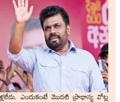
వెళ్లలేదు. ఎందుకంటే మొదటి ప్రాధాన్య వోట్ల ఆధారంగానే అభ్యర్థులు స్పష్టమైన విజేతలుగా ఆవిర్భవించారు.

శ్రీలంక: మార్క్సిస్ట్ నేత అనుర కుమార్ దిన నాయక శ్రీలంక అధ్యక్ష ఎన్నికల్లో విజేత అని దేశ ఎన్నికల కమిషన్ ఆదివారం ప్రకటించింది. ఇది వరకు ఎన్నడూ లేని విధంగా రెండవ రౌండ్ వోట్ లెక్కింపు జరిపిన తరువాత కమిషన్ ఈ ప్రకటన చేసింది. మార్క్సిస్ట్ జనతా విముక్తి పేరమున (జెవిపికి) చెందిన నేషనల్ ఫ్రెండ్లీ పవర్ (పిపిఎ) అభ్యర్థి దిననాయక (56) తన సమీప ప్రతర్థి సమగి జన బలవేగాయ (ఎన్.జె.బి)కి సాజితీ ప్రేమదాసను ఓడించారు. ప్రస్తుత అధ్యక్షుడు రణిల్ విక్రమసింహ పోటు జాబితాలో మొదటి రెండు స్థానాల్లో లోకసేవ దండ్రి మొదటి రౌండ్ లో నుంచే నిర్ణీతమైంది. కాగా, దిననాయక సోమవారం ప్రమాణ స్వీకారం చేసారని ఎన్.పి.టి. తెలియజేసింది. ఆయన శ్రీలంకకు తొమ్మిదవ అధ్యక్షుడు. శ్రీలంక చరిత్రలో ప్రథమంగా అధ్యక్ష ఎన్నిక ఆదివారం రెండవ రౌండ్ గణనకు వెళ్లింది. విజేతగా ప్రకటించడానికి కావలసిన 50 శాతం రాష్ట్ర వోట్ల శనివారం ఎన్నికల్లో ఏ అభ్యర్థికి కలగలేదంటూ వచ్చే ఎన్నికల కమిషన్ రెండవ రౌండ్ లెక్కింపును ఆదేశించింది. శ్రీలంకలో ఏ ఎన్నికలూ రెండవ రౌండ్ లెక్కింపు వరకు