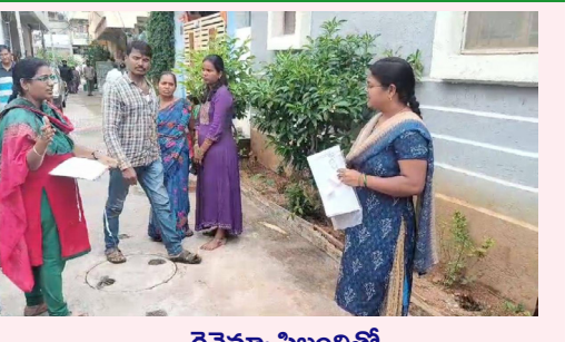
రెవెన్యూ సిబ్బందితో గొడవకు దిగిన బాధితులు