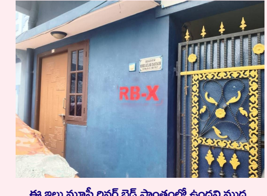
ఈ ఇల్లు మూసీ రివర్ టెడ్ ప్రాంతంలో ఉందని ముద్ద వేసిన రెవెన్యూ అధికారులు