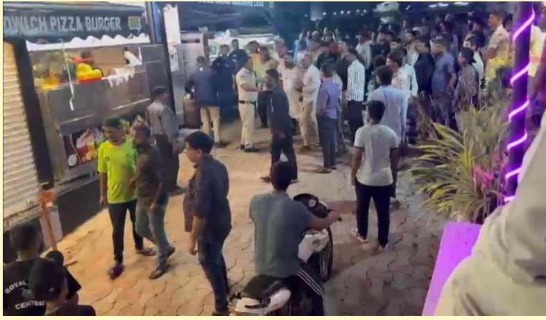
రాయల్ జ్యూస్ సెంటర్ వద్ద గుమిగూడిన యువకులు