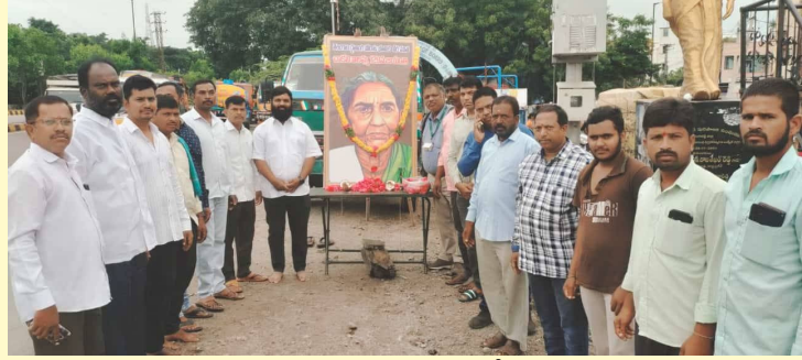
చాకలి ఐలమ్మ చిత్రపటానికి నివాళు అర్పిస్తున్న బుద్వేల్ రజక సంఘం ప్రతినిధులు