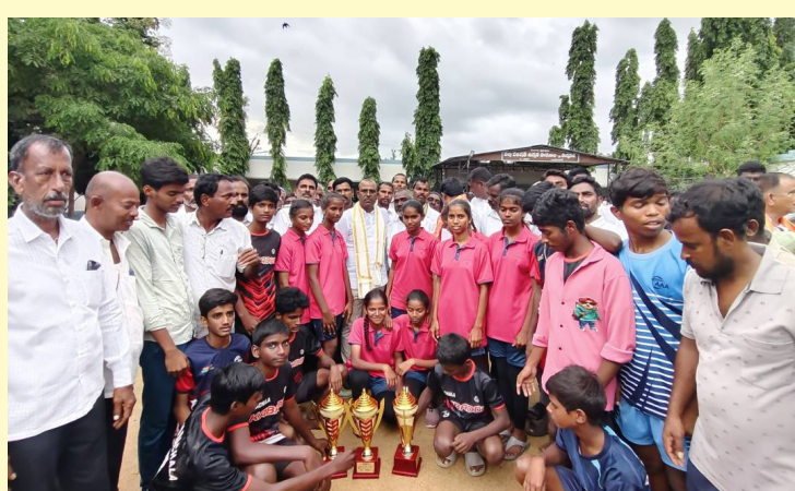
క్రీడల్లో ప్రతిభ చాటిన విద్యార్థులతో ఎమ్మెల్యే జిఎంఆర్

దేవరకర్ణ (అడ్డాలకు), సెప్టెంబర్ 26(నమస్తే ఉదయం): అడ్డాలకు మండలం పొన్నకల్ గ్రామంలో జిల్లా పరిషత్ హై స్కూల్ పాఠశాలలో సూట్ గేమ్స్ ఫెడరేషన్ ఆధ్వర్యంలో నిర్వహిస్తున్న అండర్ 14 & 17 గేమ్స్ విజేతలకు బహుమతుల ప్రదానోత్సవం లో ఎమ్మెల్యే జిఎంఆర్ ముఖ్య అతిథిగా పాల్గొని విజేతలకు బహుమతులు ప్రదానం చేశారు. అనంతరం ఎమ్మెల్యే జిఎంఆర్ విద్యార్థులను ఉద్దేశించి మాట్లాడుతూ... విద్యార్థులు చదువుతోపాటు క్రీడలపై దృష్టి సారించాలని, గెలుపొటమలను క్రీడా స్ఫూర్తితో