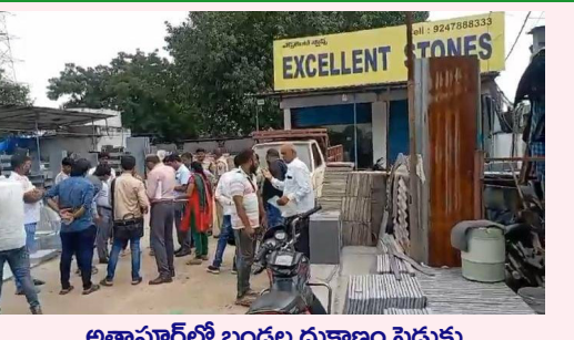
అత్తాపూర్ లో బందల దుకాణం షెడ్యూలు ముద్ద వేయడానికి వచ్చిన అధికారులు