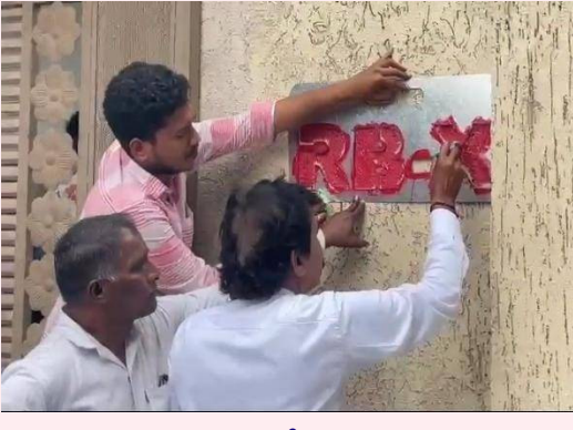
ముద్ద వేస్తున్న అధికారులు