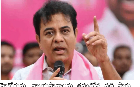
హైకోర్టును, న్యాయస్థానాలను తప్పుదోవ పట్టి స్తారు. ఫార్మా సిటీ వెనుక వేల కోట్ల భూ కుంభకాణం ఉంది. అన్ని వివరాలను త్వరలోనే బయటపెడతాం. నీ ఆన్వయములకు వేల కోట్ల రూపాయల లబ్ధి చేసే కుట్ర చేస్తున్నావ్. ఫార్మా సిటీ ఉన్నట్టూ లేనట్టూ? ఈ ప్రభుత్వం రేపు హైకోర్టులో స్పష్టం చేయాలి. 14 వేల ఎకరాలలో, 64 వేల కోట్ల పెట్టుబడిలతో మేము ఫార్మాసిటీని ప్రతిపాదించాం. అందుకొనసాగి కండ్లపల్లె ల్యాండ్ అక్విజిషన్ వేసాం. ఆ భూములను ఇతర అవసరాలకు మళ్లించే అవకాశం లేదు. అలా భూములను ఇతర అవసరాల కోసం మళ్లించి వేల కోట్ల స్వాం చేయాలని ప్రయత్నిస్తున్నారు. ఫార్మాసిటీ ఉంటే 14 వేల ఎకరాలు ఉండాలి. లేదంటే రైతులకు భూములు తిరిగి ఇచ్చేయాలి.

● ఫార్మాసిటీ ఉన్నట్టూ లేనట్టూ ● ఫార్మాసిటీ ఉంటే 14 వేల ఎకరాలు ఉండాలి ● లేదంటే రైతులకు భూములు తిరిగి ఇచ్చాలి: కేటీఆర్ నీసినెల్ల, సెప్టెంబర్ 26 (నమస్తే ఉదయం): ఫోర్ట్ సీటీ పేరుతో తన సోదరులకు వేల కోట్లు లబ్ధిచేసే కుట్ర. ఫార్మాసిటీ వ్యవహారంలో ప్రభుత్వంపై కేటీఆర్ సంవలన ఆరోపణలు. ఫార్మాసిటీ ఉన్నట్టూ లేనట్టూ స్పష్టం చేయండి. కోర్టులో మాత్రం ఫార్మాసిటీ కొనసాగుతుందంటూ న్యాయస్థానాలను తప్పుదోవ పట్టిస్తున్నారు. ఫార్మాసిటీని రద్దు చేస్తే రైతుల భూమి వారికి అప్పగించాలి. ఫార్మాసిటీని రద్దు చేస్తున్నట్లు ముఖ్యమంత్రి సహా మంత్రులు చాలా సందర్భాల్లో ప్రకటించారు. అదే నిజమైతే రైతుల నుంచి సేకరించిన భూమిని వారికి తిరిగి ఇచ్చేయాలి. ఇదే ప్రభుత్వం ఒకవైపు ఫార్మాసిటీ రద్దు చేశామంటూనే హైకోర్టులో మాత్రం ఫార్మాసిటీ రద్దు కాలేదని చెబుతోంది. పూర్వంలో నీటి, ఏబి నీటి, ఫోర్ట్ నీటి అంటున్నారు. దాని కొనసాగు ఒక్క ఎకరం భూమిని సేకరించారా? ఒక్క ఎకరం సేకరించకుండా ఫార్మా సిటీ భూములను ఇతర అవసరాలకు ఎలా మళ్లిస్తారు? ఏ విధంగా