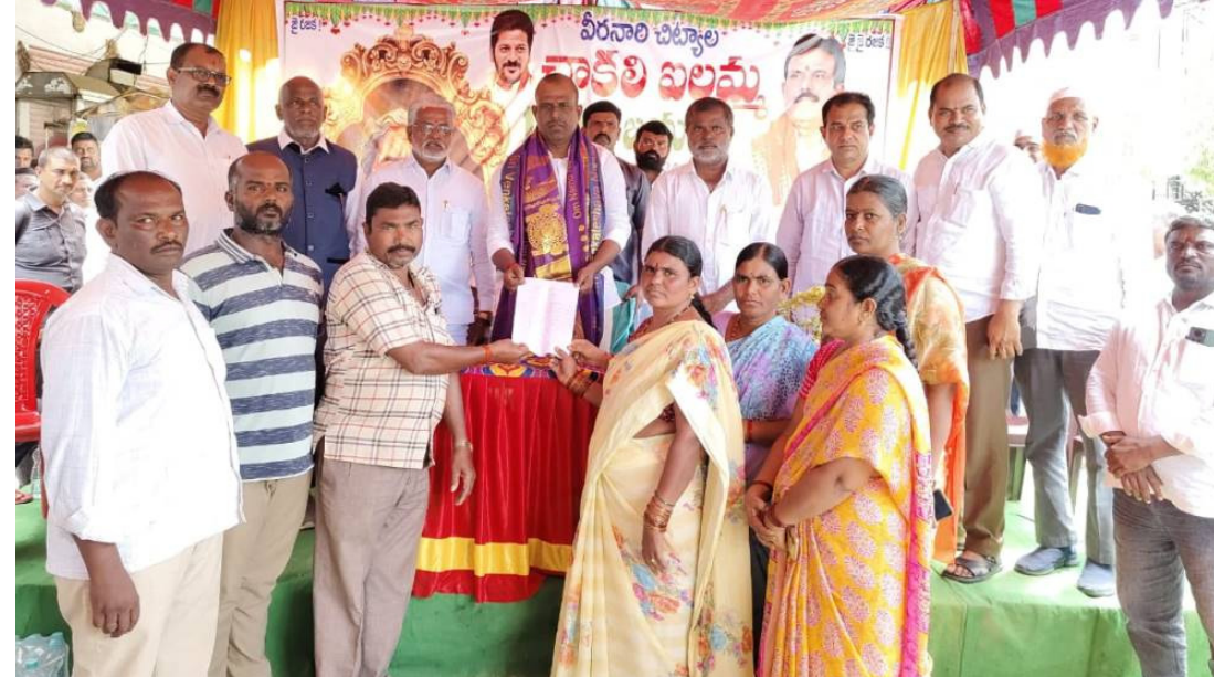
ఎమ్మెల్యేకు వినతి పత్రం అందజేస్తున్న కూరగాయల వ్యాపారులు

కొత్తకోట, సెప్టెంబర్ 26(నమస్తే ఉదయం): కొత్తకోట మున్సిపాలిటీ కేంద్రంలో గత కొన్ని సంవత్సరాలుగా కూరగాయల వ్యాపారస్తులు కూరగాయలు విక్రయించడానికి రైతు బజారు, స్థలము లేనందున కూరగాయల వ్యాపారస్తులు గురువారం దేవరకర్ణ ఎమ్మెల్యే జి.మధుసూదన్ రెడ్డి కి మార్కెట్ ను ఏర్పాటు చేయాలని వినతిపత్రాన్ని అందజేశారు. ఈ సందర్భంగా వారు మాట్లాడుతూ... ఈ మార్కెట్ను గ్రామపంచాయతీ ఏర్పైతే కూలదోసిందో అదే స్థలంలో మార్కెట్టు నిర్మించాలని కోరారు. మున్సిపాలిటీ చైర్మన్ సుకేసినీ మీకు ఆరు నెలల్లో హార్డి చేస్తానని హామీ ఇచ్చి ఇప్పటివరకు మార్కెట్లో నిర్మించకపోవడం బాధాకరమన్నారు. మాకు ఉన్నటువంటి 12 షాపులను నేలమట్టం చేశారని వాటికి మేము అద్దె చెల్లిస్తూ ఉండేవారమని మా కూరగాయలు పెట్టుకోవడానికి భద్రత లేదని ఆవేదన వ్యక్తం చేశారు. మాకు గ్రామపంచాయతీ స్థలంలోనే మార్కెట్ ఏర్పాటు చేయాలని ఎమ్మెల్యేను కోరినట్లు తెలిపారు. కార్యక్రమంలో కూరగాయల సంఘం అధ్యక్షులు నాగరాజు, తదితరులు పాల్గొన్నారు.