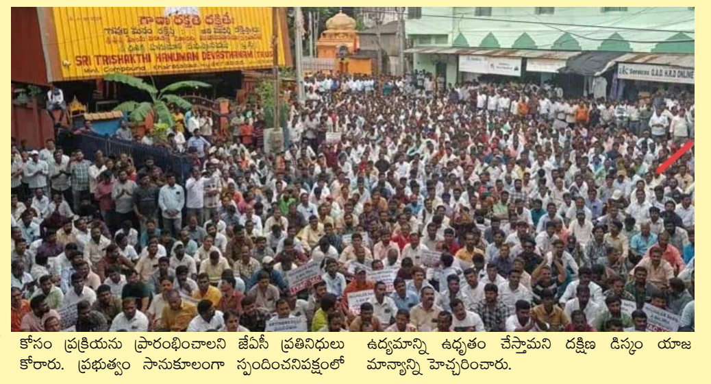
కోసం ప్రక్రియను ప్రారంభించాలని జేపీసీ ప్రతినిధులు కోరారు. ప్రభుత్వం సానుకూలంగా స్పందించనివ్వకపోతే ఉద్యమాన్ని ఉధృతం చేస్తామని దక్షిణ డిస్ట్రీక్ట్ మాజీ మాన్యువల్ హెచ్చరించారు.

హైదరాబాద్, సెప్టెంబర్ 26(నమస్తే ఉదయం): దీర్ఘ కాలంగా ఆపరిమితంగా ఉండిపోయిన విద్యుత్ శాఖలో పనిచేసే ఆర్జిజన్ల రెగ్యులరైజేషన్ ప్రక్రియను ప్రభుత్వం వెంటనే కంప్లీట్ చేయాలని డిమాండ్ చేస్తూ దక్షిణ డిస్ట్రీక్ట్ క్వార్టర్ల ముందు భారీ స్ట్రాయిలో ఆ కార్మికుల జేపీసీ ఆందోళన నిర్వహించింది. ఆర్జిజన్ల కన్వెన్షన్ ప్రక్రియను ముగించాలని, అర్జులైన వారిని క్రమబద్ధీకరించాలని, ఆ తర్వాతనే మిగిలిన పోస్టులను భర్తీ చేయాలని డిమాండ్ చేశారు. పలు జిల్లాల నుంచి వేలాది మంది పాల్గొన్న ఈ ధర్నాలో మింట్ కాంపౌండ్ ప్రాంతం దిగ్బంధమైంది. నినాదాలతో సచివాలయ పరిసర ప్రాంతమంతా మార్మోగింది. జూనియర్ లైన్స్, జూనియర్ అసిస్టెంట్, సబ్-ఇన్స్పెక్టర్ పోస్టుల్లో భర్తీ చేయడానికి ముందే ఆర్జిజన్ల సర్వీసును రెగ్యులరైజేషన్ చేయాలని కార్మికులు డిమాండ్ చేశారు. కార్మికుల విద్యార్థతలకు అనుగుణంగా పదోన్న తులు కల్పించాలని డిమాండ్ చేశారు. రాష్ట్ర ప్రభుత్వం కూడా వెంటనే స్పందించి రెగ్యులరైజేషన్, పదోన్నతుల