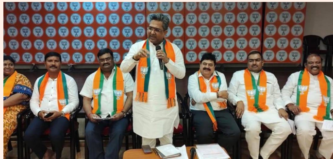
సమావేశంలో ప్రసంగిస్తున్న సునీల్ బస్సల్

హైదరాబాద్, సెప్టెంబర్ 6 (సమస్తి ఉదయం): రాష్ట్రంలో 50 లక్షల పాల్లీ సభ్యత్వ నమోదు చేపట్టాలని పాల్లీ శ్రేణులకు బిజెపి రాష్ట్ర ఇంచార్జ్ సునీల్ బస్సల్ పిలుపునిచ్చారు. గురువారం రాత్రి బిజెపి రాష్ట్ర కార్యాలయంలో బిజెపి సభ్యత్వ నమోదుపై జరిగిన సమావేశంలో బిజెపి జాతీయ ప్రధాన కార్యదర్శి, బిజెపి రాష్ట్ర ఇంచార్జ్ సునీల్ బస్సల్ ముఖ్యఅతిథిగా పాల్గొన్నారు. ఈ సందర్భంగా ఆయన మాట్లాడుతూ... కేంద్రంలోని ప్రధాన సరేంద్ర మోడి