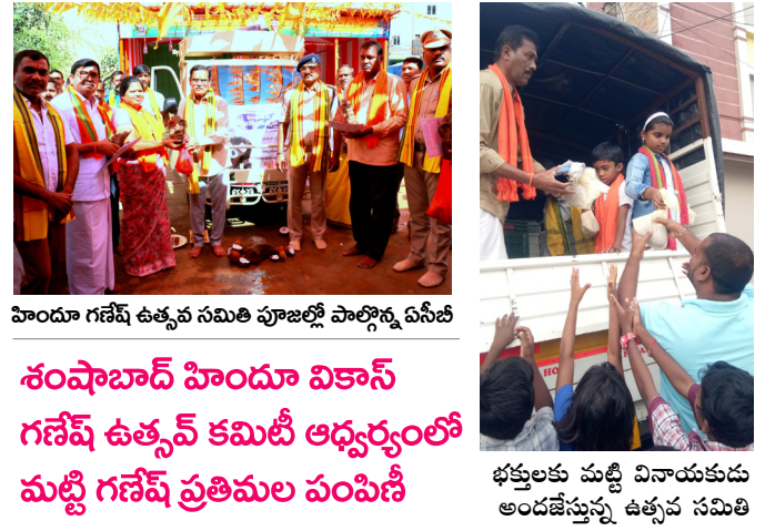
పాండు గణేష్ ఉత్సవ సమితి పూజల్లో పాల్గొన్న పసిబి శంషాబాద్ హిందూ వికాస్ గణేష్ ఉత్సవ కమిటీ ఆధ్వర్యంలో మట్టి గణేష్ ప్రతిమల పంపిణీ భక్తులకు మట్టి వినాయకుడు అందజేస్తున్న ఉత్సవ సమితి

శంషాబాద్, సెప్టెంబర్ 6 (నమస్తే ఉదయం): శంషాబాద్ మున్సిపాలిటీలో హిందూ వికాస్ గణేష్ ఉత్సవ కమిటీ తరఫున, కాలుష్య నివారణలో భాగంగా 1100 మట్టి వినాయక మిగతా.. 2లో