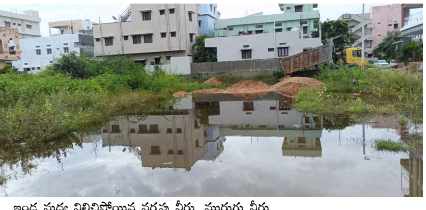
ఇండ్ల చుట్టూ నిలిచిపోయిన వర్షపు నీరు, మురుగు నీరు