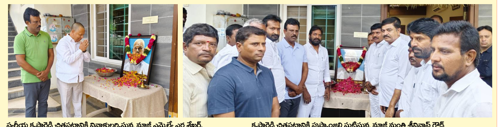
స్వల్పాయు కృష్ణారెడ్డి చిత్రపటానికి నివాళులర్పిస్తున్న మాజీ ఎమ్మెల్యే ఎల్ల శేఖర్, కృష్ణారెడ్డి చిత్రపటానికి పుష్పాంజలి ఘటించునట్లు మాజీ మంత్రి శ్రీనివాస్ గౌడ్