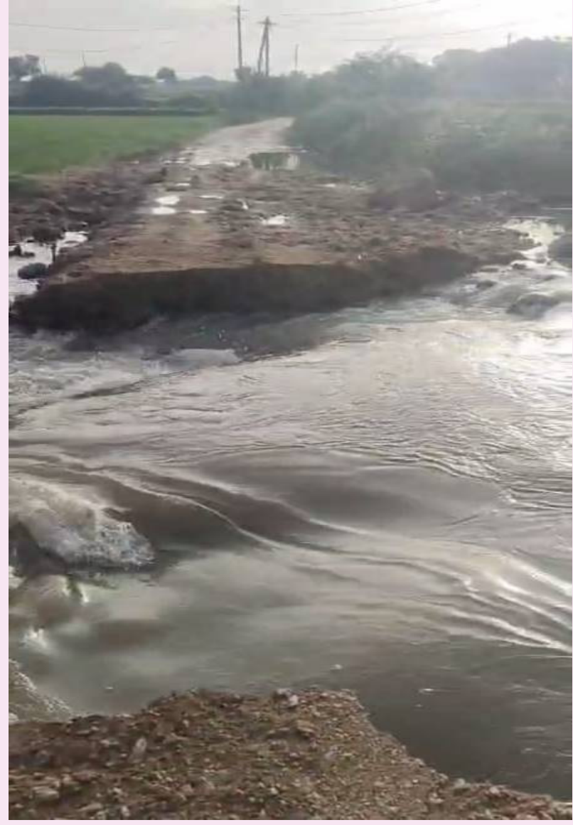
పాతపాలెం కొత్తపాలెం గ్రామాల మధ్య తెగిన మట్టి రోడ్డు

గద్వాల జిల్లా ప్రతినిధి, సెప్టెంబర్ 6(నమస్తే ఉదయం): గురువారం సాయంత్రం నుంచి భారీ వర్షం ఎడతెరిపి లేకుండా కురవడంతో తేటిదాడ్డి మండలంలోని వాగులు, వంకలు ఉప్పొంగి ప్రవహించడంతో అయా గ్రామాలకు రాకపోకలు నిలిచిపోయాయి. మండలంలో 56.4 మి.మీ. వర్ష పాతం నమోదు అయ్యింది. దీంతో వాగులు ఉప్పొంగి ప్రవహించాయి. కల్వర్లులు, బ్రిడ్జిలపై నీళ్లు ప్రవహించడంతో సందిన్నె కుచినెర్ గ్రామాల మధ్య రాకపోకలకు అంతరాయం ఏర్పడింది. ఎక్కడి వాహనాలు అక్కడే నిలిచిపోయాయి. ప్రయాణికులు తీవ్ర ఇబ్బంది పడ్డారు. పాతపాలెం, కొత్తపాలెం గ్రామాల మధ్య ఉన్న వాగు ఉద్ధృతంగా ప్రవహించడంతో తాత్కాలికంగా ఏర్పాటు చేసిన మట్టి రోడ్డు కొలుకపోయింది. దీంతో ఆ రెండు గ్రామాల మధ్య రాకపోకలు నిలిచిపోయాయి. అదే