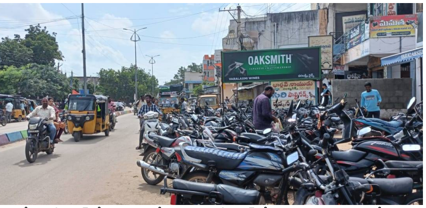
నడిరోడ్డుపై పార్కింగ్ చేసి ఉండడంతో వెనుక నుంచి వచ్చే వాహనాలు, పాదచారులు తీవ్ర ఇబ్బందులకు గురవుతున్నారు. ట్రాఫిక్ పోలీసులు ఎక్కువగా ట్రాఫిక్ సిగ్నల్స్ కేంద్రాల వద్ద డ్యూటీ, డ్రెస్ కలెక్షన్ డ్రైవ్, వాహనాల తనిఖీలు చేయడమే సరిపోతోంది. ఇక రోడ్డుపైనే పార్కింగ్ చేసిన వాహనాల విషయంలో దృష్టిపెట్టడం లేదని పట్టణ ప్రజలు ఆరోపిస్తున్నారు. ఇప్పటికైనా ట్రాఫిక్ పోలీస్ అధికారులు చొరవ తీసుకొని పైవేటు వాహనాలను రోడ్డు మీదనే పార్కింగ్ చేయకుండా చూడాలని పాదచారులు కోరుతున్నారు.

గద్వాల జిల్లా ప్రతినధి, సెప్టెంబర్ 6 (సమస్తి ఉదయం): జిల్లా కేంద్రంలో ట్రాఫిక్ సమస్య వేధిస్తోంది. జిల్లా కేంద్రంలో ప్రధాన రహదారులు ఇరుకుగా ఉండటంతో పోలీసు అధికారుల పర్యవేక్షణ లేకపోవడంతో రోడ్డుపై అడ్డబిడ్డంగా వాహనాలు పార్కింగ్ చేయడంతో ట్రాఫిక్ జామ్ అవుతోంది. ప్రధాన రహదారుల వెంట ఎక్కడ చూసినా ఇదే పరిస్థితి కనిపిస్తోంది. పలు చోట్ల ఫుల్ పార్కింగ్ అక్రమించడంతో షాపింగ్ కోసం వచ్చిన వారు తమ వాహనాలను రోడ్డు పైనే పార్కింగ్ చేయడంతో ట్రాఫిక్ జామ్ ఏర్పడి పలు ప్రమాదాలు జరుగుతున్నాయి. ఓ వైపు ట్రాఫిక్ పోలీసులు ట్రాఫిక్ నిబంధనలు పాటించాలని వాహనదారులకు అవగాహన కల్పిస్తు ఉన్నా.. మరో వైపు వాహనదారులు తమ వాహనాలను ఇష్టానుసారంగా పార్కింగ్ చేస్తున్నారు. దీంతో వాహనాల రాకపోకలకు తీవ్ర అంతరాయం ఏర్పడుతుంది. రాజవీధి, పాతబస్టాండ్, కొత్తబస్టాండ్, కృష్ణవేణి చౌరస్సా, రాజీవ్ మార్గ్, తదితర ప్రాంతాలలో వాహనదారులు అడ్డూ అడ్డువు లేకుండా