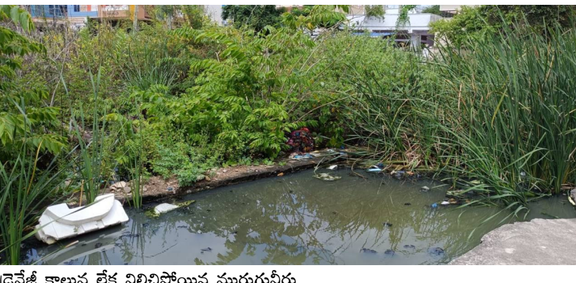
డ్రైనేజీ కాలువ లేక నిలిచిపోయిన మురుగునీరు