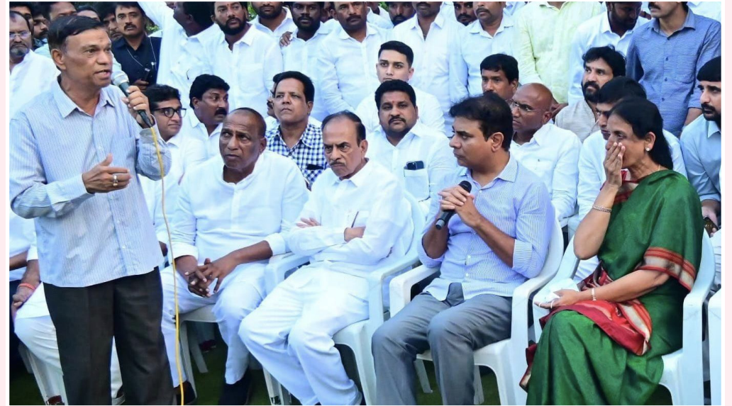
అత్తాపూర్ లక్ష్మీనగర్ పార్కులో బఫర్ జోన్ లో ఉన్న ఇండ్ల లబ్ధిదారుల బాధలు వింటున్న మాజీ మంత్రులు

హైదరాబాద్, సెప్టెంబర్ 30 (నమస్తే ఉదయం): హైద్రా తీరుపై తెలంగాణ హైకోర్టు ఆగ్రహం వ్యక్తం చేసింది. రంగారెడ్డి జిల్లా అమీన్ పూర్ లో కూల్చివేతలపై పలువురు ఉన్నత న్యాయస్థానాన్ని ఆశ్రయించారు. దీనిపై సోమవారం విచారణ జరిగింది. విచారణకు హైద్రా కమిషనర్ రంగారెడ్డి వర్చువల్ గా, అమీన్ పూర్ తహసీల్దార్ కోర్టులో హాజరై తీవ్రంగా ఇచ్చారు. శని, ఆదివారాలు, సూర్యాస్తమయం తర్వాత ఎందుకు కూల్చివేతలు చేపడుతున్నారని హైకోర్టు ఆగ్రహం వ్యక్తం చేసింది. ఆదివారం మీరు ఎందుకు పని చేయాలని ప్రశ్నించింది. సెలవుల్లో ఎందుకు నోటీసులు ఇచ్చి, అత్యవసరంగా మిగతా.. 2లో