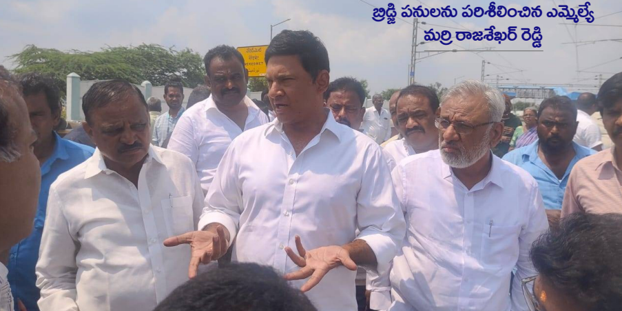
బిడ్డ పనులను పరిశీలించిన ఎమ్మెల్యే మర్రి రాజశేఖర్ రెడ్డి