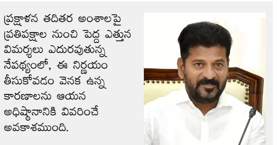
ప్రజాశాసన తదితర అంశాలపై ప్రతిపక్షాల నుంచి పెద్ద ఎత్తున విమర్శలు ఎదురవుతున్న నేపథ్యంలో, ఈ నిర్ణయం తీసుకోవడం వెనక ఉన్న కారణాలను ఆయన అధిష్టానానికి వివరించే అవకాశముంది.

హైదరాబాద్, సెప్టెంబర్ 30 (నమస్తే ఉదయం): తెలంగాణ ముఖ్యమంత్రి రేవంత్ రెడ్డి డిల్లీకి బయల్దేరారు. ఇటీవల జమ్మకర్షీర్ ఎన్నికల ప్రచారంలో అస్పష్టతకు గురైన విజనీస్ అభ్యర్థుడు మల్లికార్జున ఖర్గేను మంగళవారం ఆయన పరామర్శించనున్నారు. ఆ తర్వాత డిల్లీలోని పార్టీ ముఖ్యనేతలతో సమావేశం కానున్నారు. హైద్రా, మూసీ