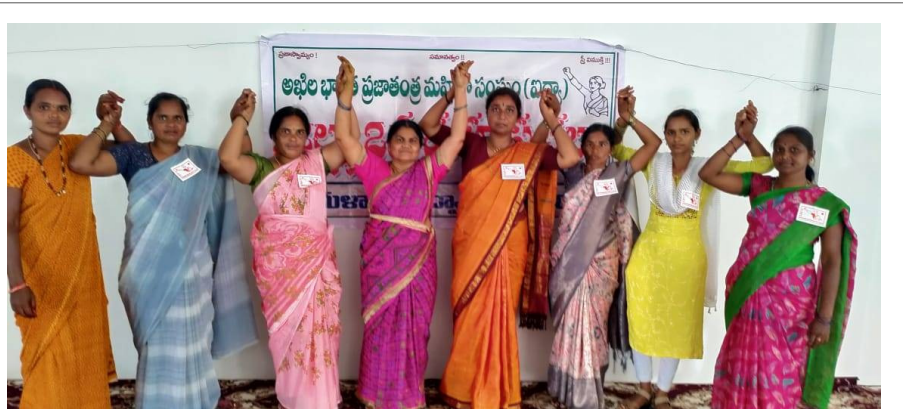
అఖిల భారత ప్రజాతంత్ర మహిళ సంఘము