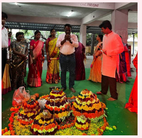
బతుకమ్మ ఆట ఆడుతున్న మహిళా అధికారులు, ఉద్యోగులు