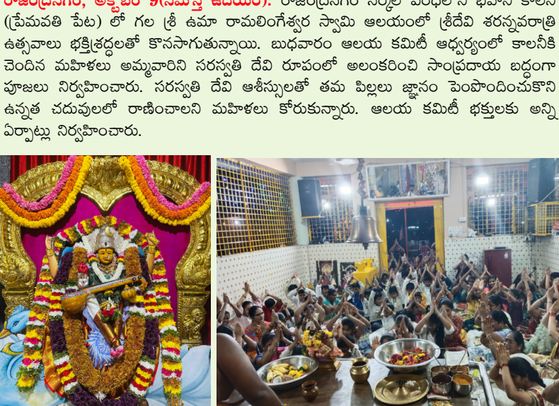
సరస్వతి దేవి అలంకరణ సందర్భంగా విద్యార్థిని విద్యార్థులతో సరస్వతి పూజ

రాజేంద్రనగర్, అక్టోబర్ 9 (నమస్తే ఉదయం): రాజేంద్రనగర్ సర్కిల్ పరిధిలోని భవని కాలనీ (ప్రేమవతి పేట) లో గల శ్రీ ఉమా రామలింగేశ్వర స్వామి ఆలయంలో శ్రీదేవి శరన్నవరాత్రి ఉత్సవాలు భక్తిచక్రంతో కొనసాగుతున్నాయి. బుధవారం ఆలయ కమిటీ అధ్యక్షులతో కాలనీకి చెందిన మహిళలు అమ్మవారిని సరస్వతి దేవి రూపంలో అలంకరించి సాంప్రదాయ బద్ధంగా పూజలు నిర్వహించారు. సరస్వతి దేవి ఆశీస్సులతో తమ విల్లలు జ్ఞానం పెంపొందించుకొని ఉన్నత చదువులలో రాణించాలని మహిళలు కోరుకున్నారు. ఆలయ కమిటీ భక్తులకు అన్ని ఏర్పాట్లు నిర్వహించారు.