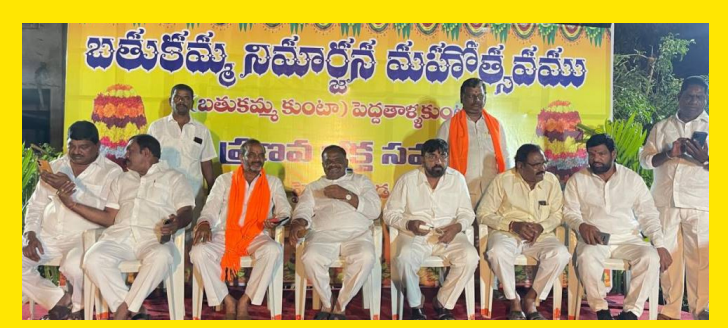
బతుకమ్మ వేడుకల్లో ప్రణవభక్త సమాజం ప్రతినిధులు

సరస్వతి దేవి అలంకరణలో పిల్లలకు మంచిగా బోధన తో పాటు జ్ఞానం బుద్ధి క్రీడాల్లో కూడా అన్నిటాల్లో ముందుకు వాలాలని కుటుంబ సభ్యులు అంతా అమ్మవారిని కోరుకుంటున్నామని తెలిపారు.