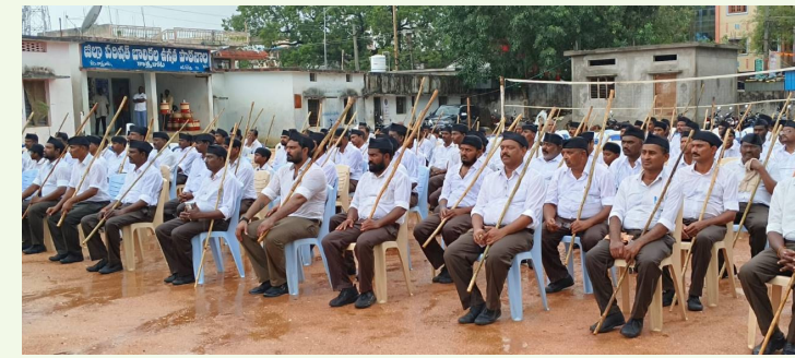
కొత్తకోట పట్టణ కేంద్రంలో నిర్వహిస్తున్న ఆర్ఎస్ఎస్ కార్యక్రమం