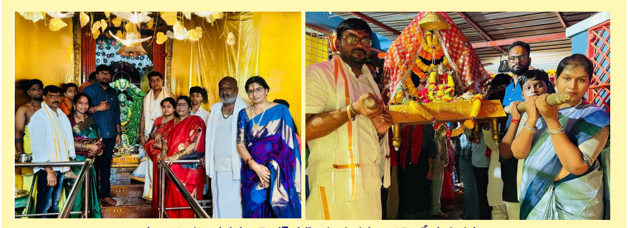
అమ్మవారిని దర్శించుకున్న ఇన్స్పెక్టర్ సరసింహ దంపతులు, ఎన్సై శ్రీకాంత్ దంపతులు