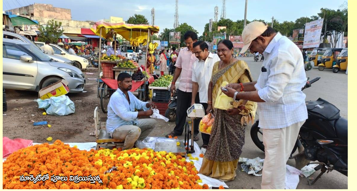
మార్కెట్లో పూలు విక్రయిస్తున్న