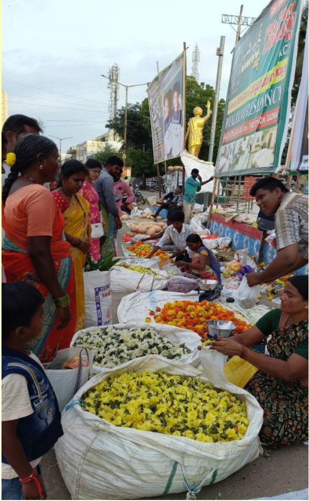
మార్కెట్లో పూలు విక్రయిస్తున్న