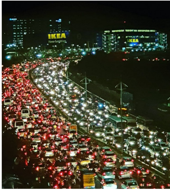
ట్రాఫిక్ను మనిటరింగ్ చేస్తారు. ట్రాఫిక్ జాయింట్ సీటీ సైతం పరిస్థితిని సమర్థించేలా ఆయన కార్యాలయానికి కనెక్ట్ చేశారు. ఇటీవల భారీ వర్షాలు వచ్చినప్పుడు ఎలాంటి ట్రాఫిక్ ఇబ్బందులు తలెత్తకుండా ట్రాఫిక్ పోలీసులు చర్యలు చేపట్టి సక్సెస్ అయ్యారు. ఇప్పుడు సిగ్నల్ ఫ్రీ జంక్షన్ల ఏర్పాటు సైతం సత్ఫలితాలు ఇస్తాయని, ఎన్నాళ్లుగా ఉన్న బడీ కారిడార్ ట్రాఫిక్ కష్టాలు తీరిపోతాయని సైబరాబాద్ ట్రాఫిక్ ఉన్నతాధికారులు ఆశాభావం వ్యక్తం చేశారు. ఇకపోతే నగరంలోని కేబీఆర్ పార్క్ చుట్టూరా సిగ్నల్ ఫ్రీ ప్రయాణాలు సాగేలా అందరేపాస్లు ప్రభుత్వం అందించాలి అని తీసుకొస్తుంది. జూబిలీహిల్స్ రోడ్ నంబర్ 45 వైపు సుందీ కేబీఆర్ పార్కు ప్రధాన గేటు వైపు 740 మీటర్ల మేర అతిపెద్ద భూగర్భ మార్గం నిర్మించనున్నారు. దీంతో బడీ కారిడార్, ఫిల్మినగర్ వైపు సుందీ వచ్చే వాహనాలు జూబిలీ హిల్స్ కంటే