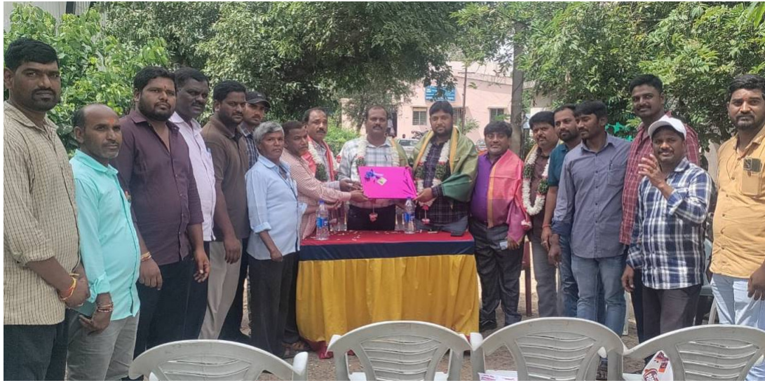
బదిలి అయిన ఏ ఈ జుబిల్ డివిజన్, నూతన ఏ రవీందర్లను సన్మానిస్తున్న ఉద్యోగులు, సిబ్బంది