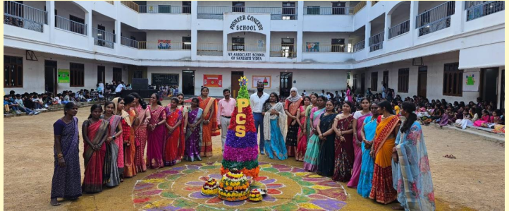
పయనీర్ కాన్వెంట్ హై స్కూల్ లో బతుకమ్మ సంబరాలలో పాల్గొన్న విద్యార్థులు, ఉపాధ్యాయులు

రాజేంద్రనగర్, అక్టోబర్ 1(సమస్తే ఉదయం): మైలార్ దేవీ పల్లి డివిజన్ టీఎన్టీఎస్ కాలనీ మహిళా కలెక్టర్ గల పయనీర్ కాన్వెంట్ హై స్కూల్ లో మంగళవారం బతుకమ్మ సంబరాలు ఘనంగా జరిగాయి.