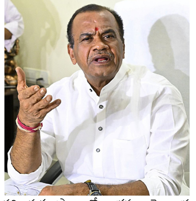
పరివాహక ప్రాంతాల్లో అక్రమణలపై రాష్ట్ర ప్రభుత్వం పూర్తి దృష్టి సారించింది. మూసీ

నిర్ణయాలన్నీంటిని కాంగ్రెస్ వ్యతిరేకించింది. ఆయోధ్య నిర్మాణంలోనూ అడ్డు చెప్పింది. అమలు చేయడాన్ని వ్యతిరేకించింది. పార్లమెంట్, విధాన సభల్లో మహిళలకు రిజర్వేషన్లను నిరాకరించింది. కాంగ్రెస్.. దేశంలో నెలకొన్న సమస్యలను పరిష్కరించడంలో విఫలమైంది. కానీ, తమ కుటుంబాన్ని మరింత మిగతా.. 2లో