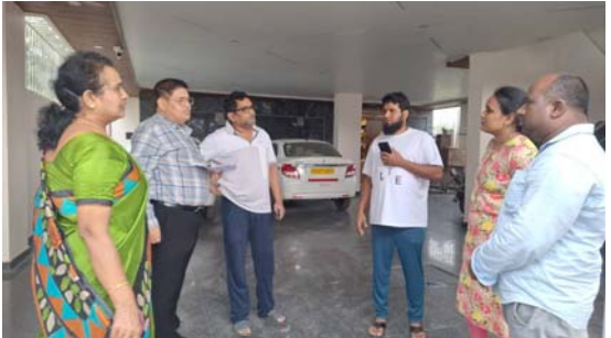
జలమండలి నీటి బిల్లు బకాయిపై పెనాల్టీ, వడ్డీ మాఫీ : ఈనెల 31 వరకు వన్ టైం సెటిల్మెంట్ స్కీమ్