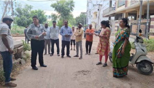
జలమండలి నీటి బిల్లు బకాయిపై పెనాల్టీ, వడ్డీ మాఫీ : ఈనెల 31 వరకు వన్ టైం సెటిల్మెంట్ స్కీమ్