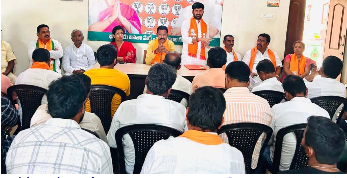
పార్టీ శ్రమించే పార్టీ బీజేపీ