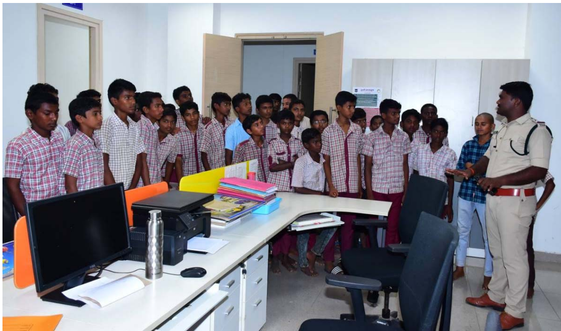
విద్యార్థులకు పోలీస్ చట్టాలపై అవగాహన కల్పిస్తున్న అధికారులు