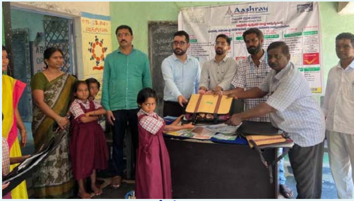
విద్యార్థులకు బ్యాగులు పంపిణీ చేస్తున్న స్వచ్ఛంద సంస్థ ప్రతినిధులు

జస్ సహస్ , ఆశ్రయ ఫౌండేషన్ గ్రీన్ సోల్ సౌజన్యంతో ఎల్లబండ తండా ప్రభుత్వ పాఠశాల విద్యార్థులకు ట్రేస్ ఐఎస్ చేతుల మీదుగా స్కూల్ బ్యాగులు, రీడింగ్