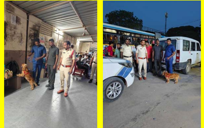
లాడ్డిలో దాగ్స్ తనిఖీ చేస్తున్న పోలీస్ అధికారులు | కొత్తకోట బస్టాండ్లో దాగ్స్ తనిఖీ చేస్తున్న పోలీస్ అధికారులు