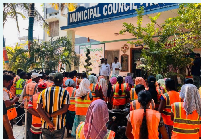
కోర్టు మున్సిపల్ కార్మికులయందు ముందు ఆందోళన చేస్తున్న కార్మికులు

తెలంగాణ రాష్ట్ర మున్సిపల్ స్టాఫ్ అండ్ జోబ్ సొల్వింగ్ వర్కర్స్ యూనియన్ (ఏబిటియూసీ) ఆధ్వర్యంలో జగిత్యాల జిల్లా మెట్ల పల్లె మున్సిపాలిటీలో శనివారం