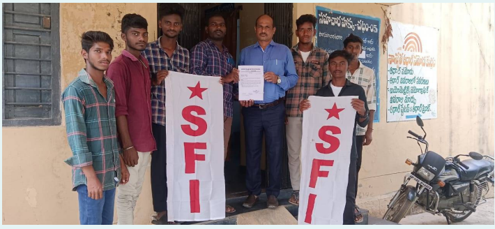
తానిల్వార కు వివేక వినయ అండ్ సెక్యూరిటీ, ఎన్ఎఫ్ఐ విద్యార్థులు