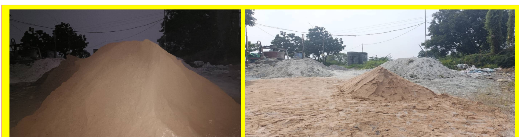
గద్వాల పట్టణం ద్వారా రోడ్డులో నిల్వ ఉంచిన ఇసుక దంపులు, గద్వాల పట్టణం ద్వారా రోడ్డులో నిల్వ ఉంచిన ఇసుక దంపుల ఖాళీ