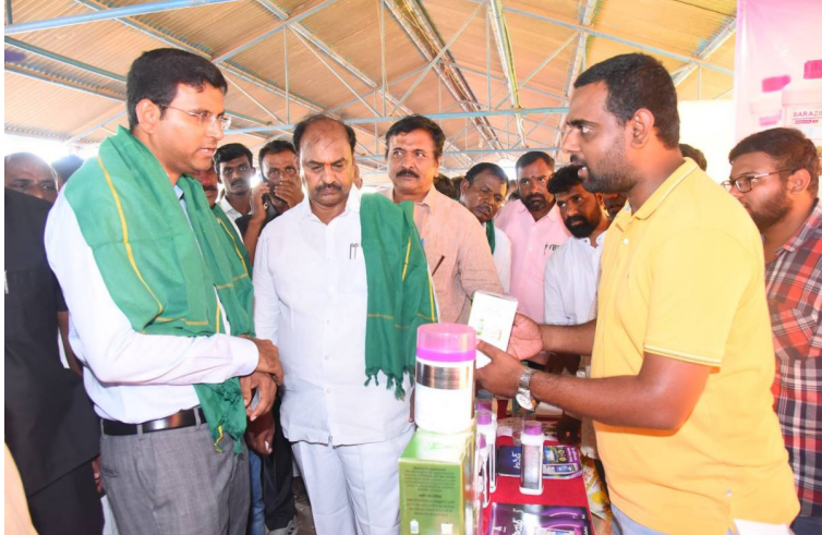
ప్రదర్శనలో విజ్ఞాన, వ్యవసాయ యాంత్రికత పై కనెక్ట్ సంతోషకు వివరాలు నిర్వాహకులు, ప్రదర్శనలో పాల్గొన్న రైతులు

అమెరికాలో అక్రమ వలసదారులను నియంత్రించాలని యూఎస్ డిపార్ట్మెంట్ ఆఫ్ హోంల్యాండ్ (డిహెచ్ఎస్) ప్రయత్నిస్తుంది. ఇందులో భాగంగా తమ దేశంలో అక్రమంగా ఉంటున్న భారతీయులను వెనక్కి పంపించినట్లు డిహెచ్ఎస్ పేర్కొంది. అక్టోబరు 22న ప్రత్యేక విమానంలో వీరిని భారత్కు పంపినట్లు తెలిపింది. భారత ప్రభుత్వం సహకారంతోనే ఈ చర్యలు చేపట్టినట్లు అమెరికా వెల్లడించింది. 'చట్టబద్ధత లేకుండా అమెరికాలో ఉంటున్న భారతీయ పౌరులను వెనక్కి పంపాలని నిర్ణయించుకున్నాం. వలస వచ్చిన ప్రజలు స్వగర్ల చేతిలో బంధీలు కాకుండా ఉండటంతో ఈ చర్యలు తీసుకుంటున్నాం' అని డిహెచ్ఎస్ సీనియర్ అధికారి (క్రీస్టి ఎ.కనెగాల్లో పేర్కొన్నారు. గత జూన్ నెలలో ది బోర్డర్ ప్రెసిడెన్షియల్ విడుదల చేసిన ప్రకటన ప్రకారం.. అమెరికా నైతిక సరిహద్దులో అసెంబ్లీలో వలసలు 55 శాతం తగ్గినట్లు డిహెచ్ఎస్ గుర్తించింది. ఈ క్రమంలోనే 2024 ఆర్థిక సంవత్సరంలో దాదాపు 1,60,000 మంది అక్రమ వలసదారులను వెనక్కి పంపినట్లు తెలిపింది. 495కు పైగా ప్రత్యేక విమానాల్లో 145 దేశాలకు చెందిన వలసదారులను వెనక్కి పంపింది. వీరిలో భారత్తో పాటు కొలంబియా, కెన్యా, పెరు, ఈజిప్ట్, మారిటానియా, సెనెగల్, ఉజ్బెకిస్తాన్, చైనా దేశాల పౌరులు ఉన్నారు. ఈ చర్యలు కలిపి సరిహద్దు సమస్యలను పరిష్కరించడం, అక్రమ వలసలను నియంత్రించడంలో పాటు చట్టబద్ధమైన వలసల మార్గాలను ప్రోత్సహించేందుకేనని అమెరికా వెల్లడించింది.