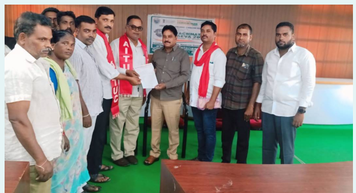
మున్సిపల్ కార్మికుల సమస్యలపై కమిషన్ వినయ వేతనాల అందజేస్తున్న ఏబిటియూసీ నాయకులు