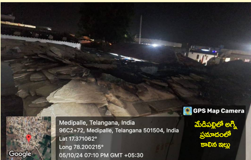
GPS Map Camera Medipalle, Telangana, India 96C2+72, Medipalle, Telangana 501504, India Lat 17.371062° Long 78.200215° 05/10/24 07:10 PM GMT +05:30