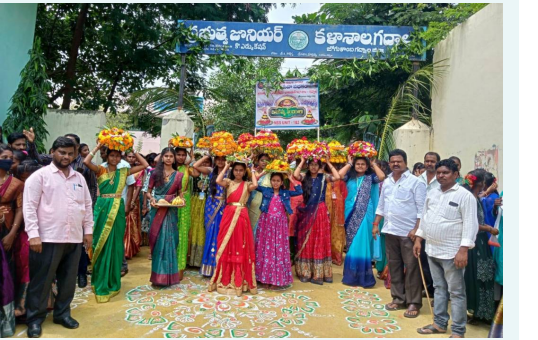
ప్రభుత్వ కళాశాలలో బతుకమ్మతో మహిళలు

తెలంగాణ పల్లె జీవితం కనిపిస్తుందని తెలిపారు. తెలంగాణ ఉద్యమంలో బతుకమ్మ ప్రాధాన్యత మరువలేదని అని ఆయన పేర్కొన్నారు. ముందుగా విద్యార్థులు గునుగు, తంగేడు, బంతి పూలతో పాటు వివిధ రకాల పూలతో బతుకమ్మలను అందంగా పేర్చి కళాశాల ప్రాంగణంలో ప్రతిష్టించి ప్రత్యేక పూజలు చేశారు. అనంతరం డిజీ చేస్తున్న మధ్య బతుకమ్మ పాటలకు అధ్యాపకులు విద్యార్థులతో కలిసి నృత్యాలు చేశారు. బతుకమ్మలను స్థానికంగా ఉన్న నది అగ్రహారం లో ఉన్న నదిలో నిమజ్జనం చేశారు. ఈ కార్యక్రమంలో కళాశాల అధ్యాపకులు, విద్యార్థులు పాల్గొన్నారు.