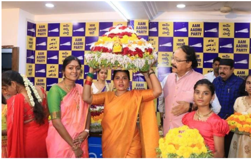
బతుకమ్మతో హేమ జిల్లా, ఆమ్ ఆర్టీ పార్టీ తెలంగాణ రాష్ట్ర మహిళా విభాగం ఆధ్వర్యంలో ట్యాంక్ బండ్ బతుకమ్మ ఘాట్ వద్ద బతుకమ్మ ఆడుతున్న హేమ జిల్లా తదితరులు