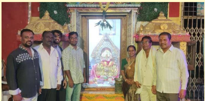
శ్రీ అన్నపూర్ణాదేవి అమ్మవారి ఆలంకరణలో కొలువదీరిన అమ్మవారు