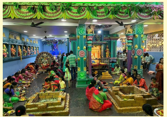
పాతబస్తి జగదాంబ ఆలయంలో శ్రీదేవి శరన్నవరాత్రి ఉత్సవాలు

రాజేంద్రనగర్, అక్టోబర్ 6(సమస్త ఉదయం): ఆమ్ ఆర్టీ తెలంగాణ రాష్ట్ర మహిళా విభాగం ఆధ్వర్యంలో హేమ జిల్లా ఆధ్వర్యంలో ఆదివారం ట్యాంక్ బండ్ బతుకమ్మ ఘాట్ వద్ద బతుకమ్మ వేడుకలు కన్నుల పండువగా నిర్వహించారు. ఈ సందర్భంగా హేమ జిల్లా మాట్లాడుతూ... తెలంగాణ సంస్కృతి, సంప్రదాయాల మేలు కల యిత్రాణ బతుకమ్మ పండుగ వేడుకలను పెద్దఎత్తున ఆమ్ ఆర్టీ పార్టీ, మహిళా విభాగం నిర్వహిస్తుందన్నారు. అట్ట బతుకమ్మ సందర్భంగా సాంఘిక 4 గంటల నుండి ట్యాంక్ బండ్ పైన ఉన్న బతుకమ్మ ఘాటు వద్ద ఈ కార్యక్రమాన్ని చేపట్టడం జరిగిందని తెలిపారు. ఈ కార్యక్రమంలో రాష్ట్ర నాయకులు, పాల్గొన్నారు.