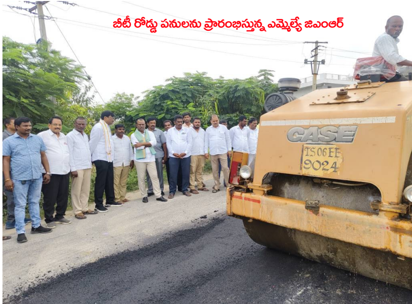
బీబీ రోడ్డు పనులను ప్రారంభిస్తున్న ఎమ్మెల్యే జిఎంఆర్