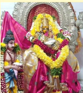
హరి హరి క్షేత్రంలో శ్రీ అన్నపూర్ణ దేవి అమ్మవారిని దర్శించుకుంటున్న భక్తులు