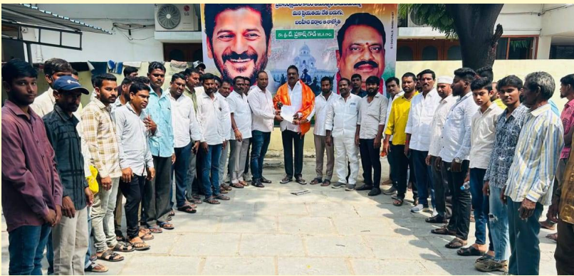
ఎమ్మెల్యే ప్రకాష్ గౌడ్ కు వినితపత్రం అందజేస్తున్న గ్రామస్థులు

శంషాబాద్, అక్టోబర్ 6(నమస్తే ఉదయం): శంషాబాద్ మండలంలోని సుల్తాన్ పల్లి గ్రామంలో ఈడ్ రోడ్డు సమస్యను పరిష్కరించాలని కోరుతూ స్థానిక ఎమ్మెల్యే ప్రకాష్ గౌడ్ కు మెమోరాండం అందజేశారు. సుల్తాన్ పల్లి మాజీ సర్పంచ్ దండు ఇస్తారు ఆధ్వర్యంలో మైనార్టీలు ఆదివారం