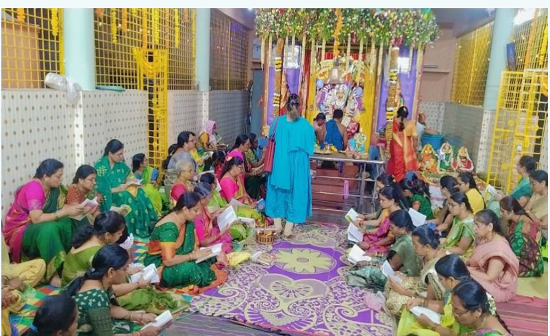
శ్రీ లక్ష్మీపూర్ణాదేవి అవతారంలో దుర్గమాత, ఉత్సవాలలో పాల్గొన్న మహిళా భక్తులు