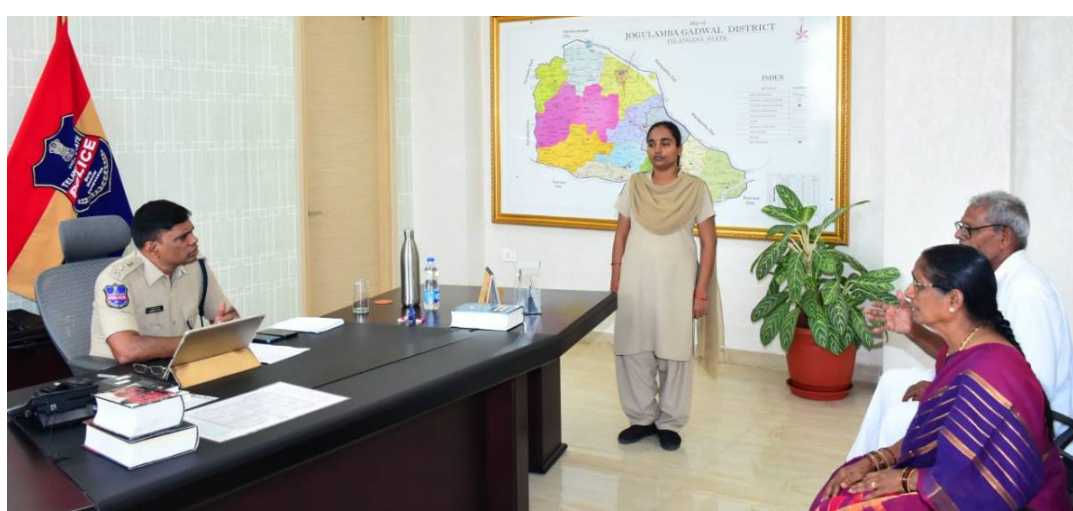
ప్రజల నుండి ఫిర్యాదులు స్వీకరిస్తున్న ఎస్పీ శ్రీనివాసరావు

గద్వాల జిల్లా ప్రతినిధి, అక్టోబర్ 7 (నమస్తే ఉదయం): శాంతి భద్రతలకు సంబంధించిన సమస్యల పరిష్కారం కోసం పోలీసు స్టేషన్ కు వచ్చే ఫిర్యాదుల పై వెంటనే చట్ట పరమైన చర్యలు తీసుకోవాలని జిల్లా ఎస్పీ టి. శ్రీనివాస రావు పోలీస్ అధికారులను ఆదేశించారు. సోమవారం ప్రజావాణి కార్యక్రమంలో భాగంగా జిల్లా పోలీసు కార్యాలయంలో వివిధ మండలాల నుంచి వచ్చిన 07 మంది బాధితుల నుంచి ఎస్పీ ఫిర్యాదులు స్వీకరించారు. అనంతరం సంబంధిత పోలీసు అధికారులతో ఫోన్లో మాట్లాడారు. పోలీస్ స్టేషన్ కు వచ్చిన ఫిర్యాదుల పై ఇప్పటి వరకు ఎలాంటి చర్యలు తీసుకున్నారో తెలుసుకున్నారు. ఆయా ఫిర్యాదుల పై వెంటనే చర్యలు చేపట్టాలని, విచారణ జరిపి, తగు చర్యలు తీసుకోని, నివేదికను అందజేయాలని ఎస్పీ పోలీస్ అధికారులను ఆదేశించారు. సోమవారం ప్రజావాణికి ఫిర్యాదులలో భార్య భర్తల గొడవకు సంబంధించి -01 ఫిర్యాదు, భూ వివాదాలు, గొడవలకు సంబంధించి -02, పొలం రిజిస్ట్రేషన్ చేసుకొని దబ్బులు ఇవ్వడం లేదని-01, చీటింగ్ కు సంబంధించి -01, ఇతర అంశాలకు సంబంధించి-02 ఫిర్యాదులు అందాయని అధికారులు తెలిపారు.