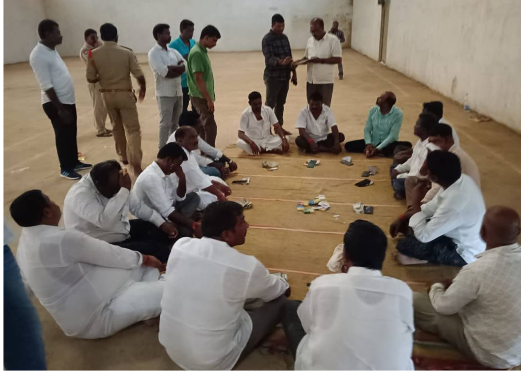
పేకాట ఆడుతున్న జూదరులను అదుపులోకి తీసుకున్న పోలీసులు