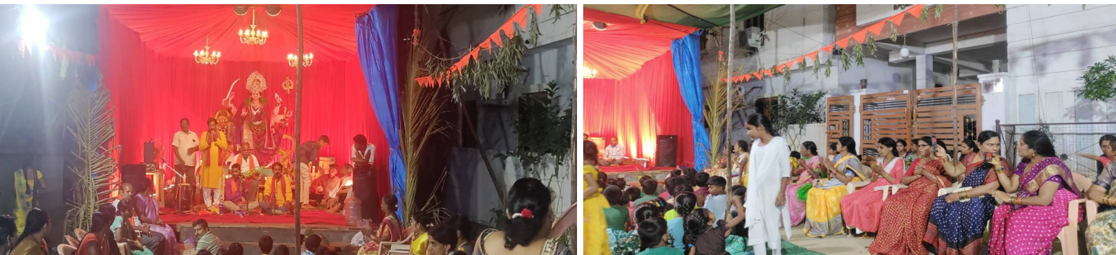
బండ్లగూడ దుర్గా దేవి కాలనీలో దుర్గామాత ప్రతిమ వద్ద భక్తి కార్యక్రమాల నిర్వహిస్తున్న ఉత్సవ కమిటీ, భక్తి కార్యక్రమాలలో పాల్గొన్న మహిళా భక్తులు

భక్తి గీతాలతో సంగీత కార్యక్రమాలు భక్తులకు అన్నదాన కార్యక్రమం బండ్లగూడ, అక్టోబర్ 7 (నమస్తే ఉదయం): బండ్లగూడ మున్సిపల్ కార్పొరేషన్ పరిధిలోని దుర్గాదేవి కాలనీలో శ్రీ దేవి శరన్నవరాత్రి ఉత్సవాల భక్తి కార్యక్రమాలలో ఘనంగా జరుగుతున్నాయి. సోమవారం కాలనీ అసోసియేషన్ ఆధ్వర్యంలో నెలకొల్పిన దుర్గామాత ప్రతిమ వద్ద పూజలు, భక్తి కార్యక్రమాలు నిర్వహించారు. ఉత్సవాలలో భాగంగా మండపం వద్ద ఉత్సవాల