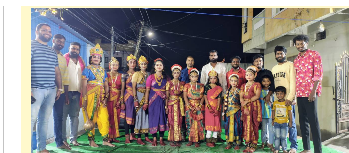
దేవుళ్ళ అవతారంలో పాత్రలు పోషించిన చిన్నారులు