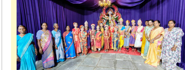
చిన్నారులతో స్నానం మహిళలు

అలరించేసిన భక్తి కార్యక్రమాలు రాజేంద్రనగర్, అక్టోబర్ 7(సమస్తి ఉదయం): రాజేంద్రనగర్ సర్కిల్ పరిధిలోని బుద్వ్యే శ్రీ వీరాంజనేయ యూత్ అసోసియేషన్ అధ్యక్షుల నెలకొల్పిన శ్రీ దర్గా మాత ప్రతిమ వద్ద శ్రీదేవి శరన్నవ