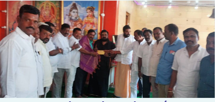
అయ్యప్ప స్వామి దేవాలయంలో పూజలు చేస్తున్న కమిటీ సభ్యులు