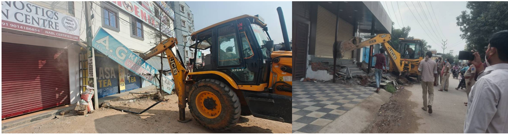
శాస్త్రపురం రోడ్డులో ఫుట్ పాత్ ఆక్రమణలను తొలగిస్తున్న రాజేంద్రనగర్ టౌన్ ప్లానింగ్ సిబ్బంది. ఫుట్ పాత్ ఆక్రమణలను తొలగిస్తున్న రాజేంద్రనగర్ సర్కిల్ టౌన్ ప్లానింగ్ సిబ్బంది