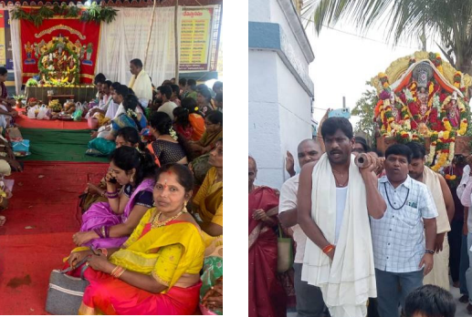
పూజల్లో పాల్గొన్న భక్తులు

కాత్కోట పట్టణ సమీపంలో వెంకటగిరి క్షేత్రం లో వెలిసిన శ్రీ భాలక్ష్మి వెంకటేశ్వర స్వామి కళ్యాణం వైభవంగా జరిగింది. పూజల అనంతరం అమ్మవారికి మంత్రోచ్ఛరణల మధ్య మేళ తాళాలతో స్వామివారి కళ్యాణం కార్తీక మాసంలోని రెండో శనివారం రోజున అంగరంగ వైభవంగా జరిగింది. శోభయమానంగా అలంకరించి కళ్యాణ మండపంలో ప్రత్యేక పూజలు నిర్వహించారు. కళ్యాణోత్సవంలో జిలకర బిల్లం కదితర పూజలు అనంతరం అమ్మవారికి మంగళసూత్ర ధారణ జరిపించారు. స్వామి వారి జన్మ నక్షత్రం త్రావణ నక్షత్రం రోజున వెంకటేశ్వర స్వామి ఉత్సవముద్ది విగ్రహాలను ఆలయం అర్చకులు పట్టు వస్త్రాలతో అలంకరణ చేసి కళ్యాణ మండపంలో అర్చకుల పేద మంత్రాలతో కళ్యాణం వైభవంగా నిర్వహించారు. సింగరా