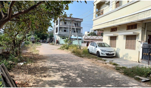
లో ఫిర్యాదు చేసింది. ఘటన స్థలానికి చేరుకున్న పోలీసులు ఆ ప్రదేశంలోని సీసీకెమెరాల ఫుటేజీల ఆధారంగా దర్యాప్తు చేస్తున్నారు.

కాగ మహిళపై దాడి చేసి ఈ ఘాతకానికీ పాల్పడటంతో ఆమె భయందోళనకు గురైంది. ఆ మహిళ కేకలతో చుట్టపక్కల వారు అక్కడకు చేరుకునే లోపు దుండగులు కంటికి కనిపించకుండా పోయారు. ఘటనపై బాధితురాలు గద్వాల టౌన్ పోలీస్ స్టేషన్