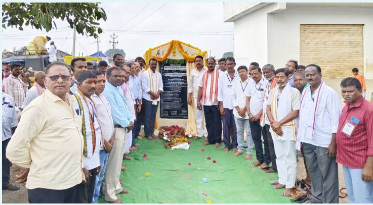
కురుమూర్తి స్వామి దేవస్థానం వద్ద మంచినీటి ట్యాంకు నిర్మాణం కోసం భూమి పూజ చేస్తున్న ఎమ్మెల్యే జిఎంఆర్