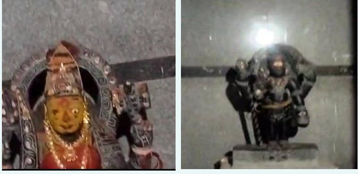
ఆలయాల్లో దుండగులు ధ్వజం చేసిన విగ్రహాలు