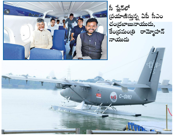
విజయవాడ కృష్ణానదిలోని పున్నమిఘాట్ వద్ద బేకాఫ్ అవుతున్న సీ షేన్

రంగారెడ్డి సంపుటి : 02 సంచిక: 107 పేజీలు: 4 వెల: 4/- ఆదివారం 10, నవంబర్ 2024 ఎడిటర్: ఎం.వనితారెడ్డి