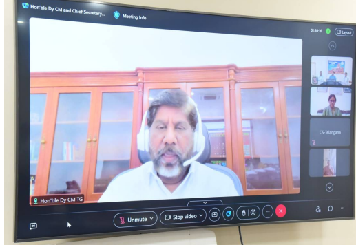
వీడియో కాన్ఫరెన్స్లో మాట్లాడుతున్న మంత్రి భట్టి విక్రమార్కు