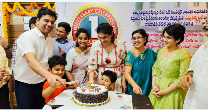
లిమ్స్ ఆస్పత్రి ప్రథమ వార్షికోత్సవం సందర్భంగా కేక్ కట్ చేస్తున్న డాక్టర్లు

శంషాబాద్, నవంబర్ 9(ప్రభాత ఉదయం): లిమ్స్ వుమెన్ అండ్ చిల్డ్రన్స్ హాస్పిటల్ ప్రథమ వార్షికోత్సవాన్ని శనివారం ఘనంగా నిర్వహించారు. శంషాబాద్ పట్టణంలోని తొండుపల్లి బోర్డర్ రింగ్ రోడ్ ఎగ్జిట్, ఎం.ఐ.టి. బోల్ గేట్ సమీపంలో ఏర్పాటు చేసిన లిమ్స్ ఆస్పత్రి ట్రాంట్ మొదటి వార్షికోత్సవాన్ని శనివారం ఘనంగా నిర్వహించారు. కిమ్స్