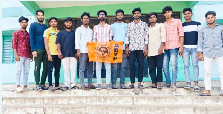
విజ ఏబీవీపీ నూతన కార్యదర్శి

గద్వాల జిల్లా ప్రతినిధి, నవంబర్ 9(నమస్తే ఉదయం): జోగులాంబ గద్వాల జిల్లా అయిజ కేంద్రంలో ఉన్న ప్రభుత్వ జూనియర్ కళాశాల ప్రాంగణంలో అఖిల భారతీయ విద్యార్థి పరిషత్ నూతన కమిటీని ఎన్నుకున్నారు. ఈ