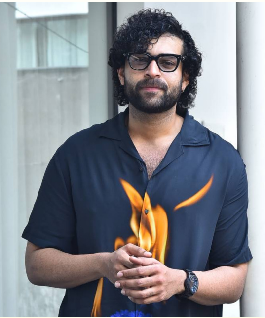
కరుణ కుమార్ గత సినిమాల్లో కుల వివక్ష అనేది ఎక్కడో అందరి లైన్ గా ఉంటుంది. ఇందులో ఎలాంటి పాయింట్ ని టచ్ చేశారు?