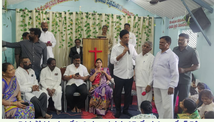
త్రైవేణి సోదరులను ఉద్దేశించి మాట్లాడుతున్న ఎమ్మెల్యే మర్రి రాజశేఖర్ రెడ్డి