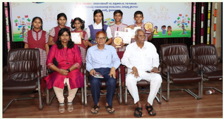
బహుమతులు గెలుచుకున్న విద్యార్థులు

బాలల దినోత్సవాలను పురస్కరించుకుని తెలంగాణ సారస్వత పరిషత్ అధ్యక్షులతో నిర్వహించిన వివిధ పోటీలలో శివరాంపల్లి జిల్లా పరిషత్ ఉన్నత పాఠశాల విద్యార్థులు