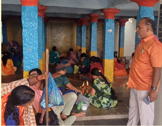
అలయం ఆవరణలో డీవాల వెలిగిస్తున్న భక్తులు, అలయంలో సామూహిక సత్యనారాయణ స్వామి వ్రతాలు చేస్తున్న భక్తులు, స్వామివారికి అభిషేకాలు చేస్తున్న భక్తులు

హైదరాబాద్, నవంబర్ 15 (నమస్తే ఉదయం): వలి సాగు ఉత్పత్తిలో తెలంగాణ అగ్రస్థానంలో ఉందని మంత్రి తుమ్మల నాగేశ్వరరావు తెలిపారు. కోటి 53లక్షల మెట్రిక్ టన్నుల దిగుబడితో సన్న రకాలు 25 నుంచి 40లక్షల ఎకరాలకు పెరిగిందని వివరించారు. తెలంగాణ ప్రభుత్వం సన్నాలకు బోసన్ ప్రకటించడమే అందుకు కారణమని అన్నారు. సంక్రాంతి నుంచి రేషన్ తో సహా అన్ని హాస్పిటల్స్ ను బియ్యం ఇవ్వాలని ప్రభుత్వం నిర్ణయించిందని అన్నారు. దొడ్డు రకం వలి సాగు 41లక్షల నుంచి 21 లక్షల ఎకరాలకు పెడిపోయిందని చెప్పారు. రాష్ట్ర అవసరాలే కాకుండా ఇతర దేశాలకు ఎగుమతి అయ్యే అవకాశం ఉందన్నారు. 7411 ధాన్యం కొనుగోలు కేంద్రాలు ఏర్పాటు చేశామని తెలిపారు. అధికారం కోల్పోయిన పార్టీ అధికారం కోసం రైతుల ఆత్మ స్వేచ్ఛం దెబ్బ తీసే ప్రయత్నం చేస్తున్నారని మండిపడ్డారు.