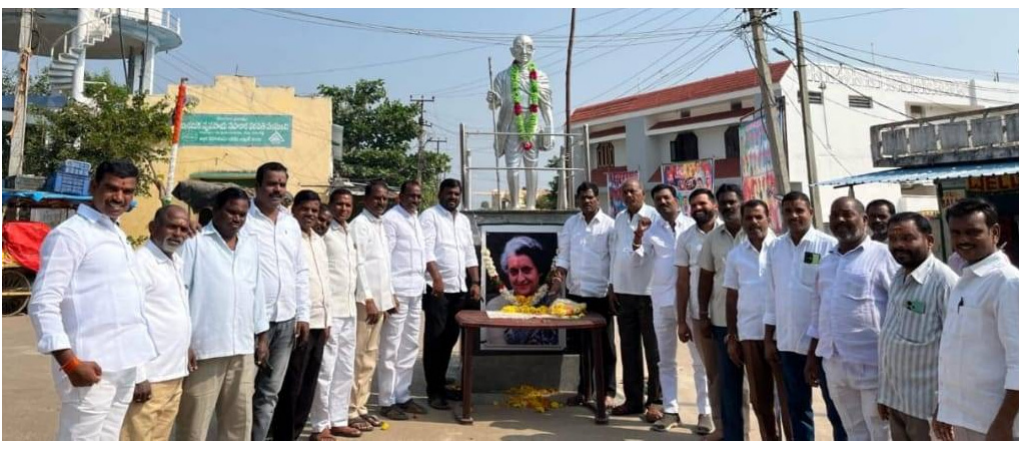
మాజీ ప్రధాని స్వర్ణీయ ఇందిరాగాంధీ చిత్రపటానికి పుష్పాంజలి ఘడిస్తున్న నాయకులు

ఇందిరాగాంధీ 107 జయంతిని ఘనంగా నివాళులు అర్పించిన నాయకులు. ఇందిరాగాంధీ 1917 నవంబర్ 19న అలహాబాద్లోని ఆనంద్ భవన్లో భారత దేశపు తొలి ప్రధాని జవహర్లాల్ నెహ్రూ, కమలా నెహ్రూ దంపతులకు జన్మించారు. ఆమె అసలు పేరు ఇందిరా ప్రియదర్శిని అని కాగా, లండన్లోని ఆక్స్ఫర్డ్ యూనివర్సిటీలో చదువుకున్నారని తెలిపారు. 1964లో ఆమె తండ్రి, భారత తొలి ప్రధానమంత్రి జవహర్లాల్ నెహ్రూ మరణం అనంతరం ఇందిరా గాంధీ రాజ్యసభకు ఎన్నికైందని లాల్ బహదూర్ శాస్త్రి మంత్రిమండలిలో ప్రసారాఖ్య మంత్రిగా ఆమె విశిష్ట సేవలు అందించినట్లుగా, కుక్లమంలో 1966లో మొదటి సారి ప్రధానమంత్రి పదవీ బాధ్యతలు స్వీకరించి... దేశ మొదటి మహిళా ప్రధానిగా ఇందిరాగాంధీ చరిత్ర సృష్టించినట్లుగా, కాగా, నేటి వరకు మరో మహిళా భారతదేశ ప్రధాని పదవిని అధిష్టించకపోవడం ఇందిరా గాంధీ ఇప్పటివరకు తొలి మహిళా ప్రధాని కావడం విశేషం అన్నారు. ఇందిరాగాంధీ ప్రధానిగా బాధ్యతలు స్వీకరించిన తర్వాత ఎన్నో విప్లవాత్మకమైన మార్పులకు శ్రీకారం చుట్టారని బ్యాంకుల జాతీయీకరణ, జమీందారీ వ్యవస్థ రద్దు, గరిబీ హతాశా వంటి