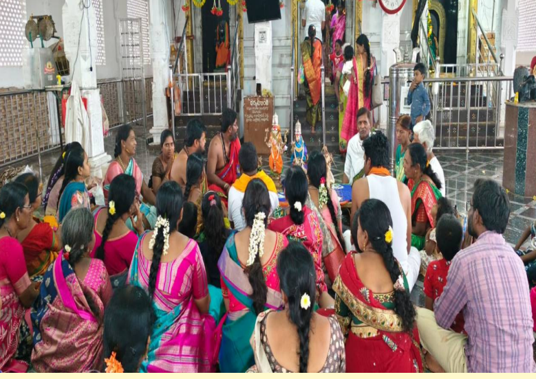
కొత్తకోట మండల కానాయపల్లి స్టేజి దగ్గర గల సుప్రసిద్ధమైన శైవక్షేత్రం

శ్రీకోటిలింగేశ్వరదేవస్థానము దగ్గర నూతనంగా నిర్మించిన ద్వాపరమందిరంలో కార్తీకమాసం సందర్భంగా కోటిలింగాల ప్రతిష్ఠతో భక్తులు పులకరించి పోయారు. ఆదోనికి చెందిన వీరశైవ ఆగమ పాఠశాల విద్యార్థులచే రుద్రవనంతో భక్తులు భక్తికర్ణలతో రుద్రవనం చేయగా అర్చకులు వేదమంత్రాలతో పదకొండు వేల శివలింగాలు కలిగిన శివకోటి యంత్రాలకు రుద్రవనంతో సంకల్ప పూజలు చేయించి భక్తుల స్వస్థానాలతో పదకొండు వేల శివలింగాలు ప్రతిష్ఠించవచ్చారు. ఈ సందర్భంగా వీరశైవ ఆగమ పాఠశాల అధ్యాపకులు మాట్లాడుతు... ఎన్నో జన్మల పుణ్యఫలం వలన మీకు ఈ లింగ ప్రతిష్ఠ చేసే భాగ్యం లభిస్తుందని దీని వల్ల మీ తరతరాల మీ లింగశివులందరు పుణ్యతీర్థాలని అన్నారు. అనంతరం అలయకమిటి అన్నప్రసాద వితరణ చేశారు.