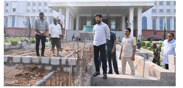
చురుకుగా తెలంగాణ తల్లి విగ్రహ ఏర్పాటు పనులు పరిశీలించిన సీఎం రేవంత్

హైదరాబాద్, నవంబర్ 22 (సమస్తి ఉదయం): సచివాలయ ప్రాంగణంలో తెలంగాణ తల్లి విగ్రహ ఏర్పాటు పనులు చురుకుగా సాగుతున్నాయి. డిసెంబర్ 9న విగ్రహ ఏర్పాటుకు ప్రభుత్వం చురుకుగా సన్నాహాలు చేస్తోంది. ఈ క్రమంలో పనులు జరుగుతున్న తీరును పరిశీలించిన ముఖ్యమంత్రి రేవంత్ రెడ్డి శుభవారం పరిశీలించారు. త్వరగా పనులు పూర్తి చేయాలని అధికారులకు సూచించారు.