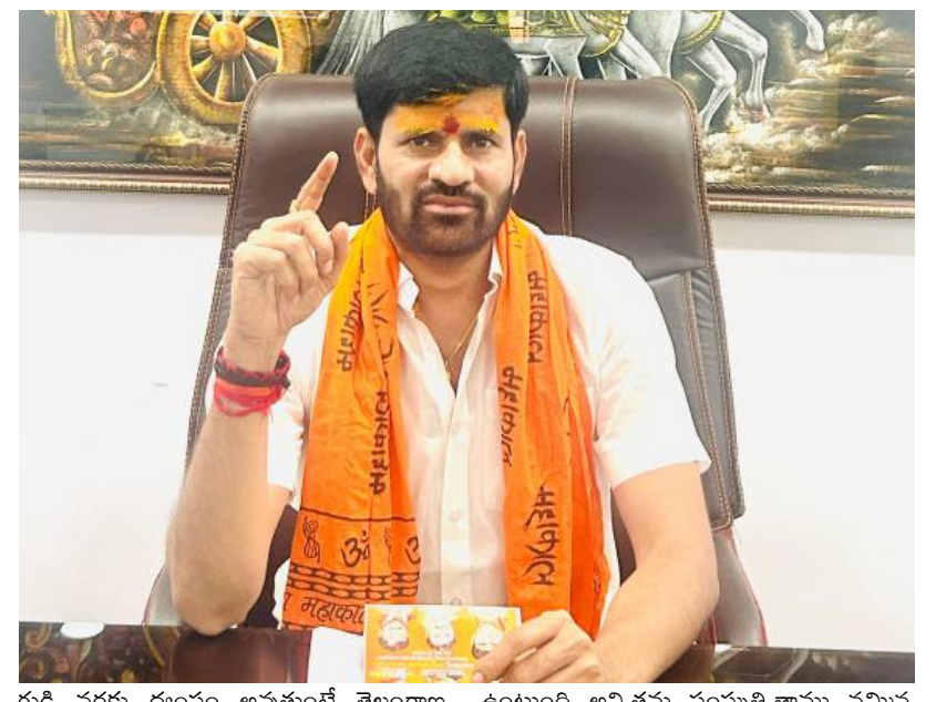
గుడి పరకు ధ్వంసం అవుతుంటే తెలంగాణ హిందువుల మనోభావాలు దెబ్బతింటుంటే, రేవంత్ రెడ్డి సర్కార్ చోద్యం చూస్తోంది అన్నారు. ధ్వంసం చేస్తున్న వారిన శిక్షించకుండా, వారి మానసిక పరిస్థితి సరిగా లేదని చేతులు దులుపుకోవడం సరికాదు అన్నారు. హిందువుల ఓర్పుకి కూడా ఒక చూపు