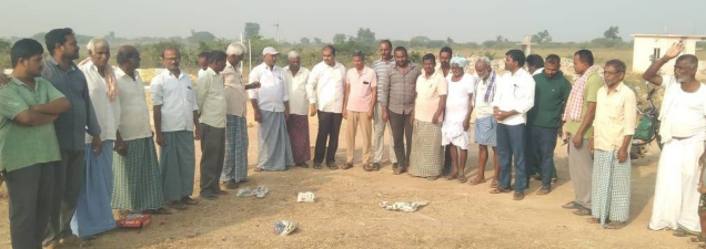
సంబరాలు జరుపుకుంటున్న రైతులు